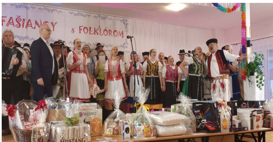
Fašiangy s folklórom

Spoločenský a kultúrny život v obci je realizovaný vďaka významnej podpore zo strany komisií pre kultúru a vzdelanie, mládež, šport, cestovný ruch, poslancov OZ a dobrovoľníkov. V obci sa počas roka realizujú kultúrne akcie prevažne v budove kultúrneho domu a bowlingovej miestnosti. Počas roka sa uskutočnili akcie Uvítanie nového roka, Fašiangy s folklórom, MDŽ, Deň matiek, MDD, Dubovickí jurmak, Športový deň, Sv. omša na Bukovej hore. Úcta k starším, Stretnutie s Mikulášom