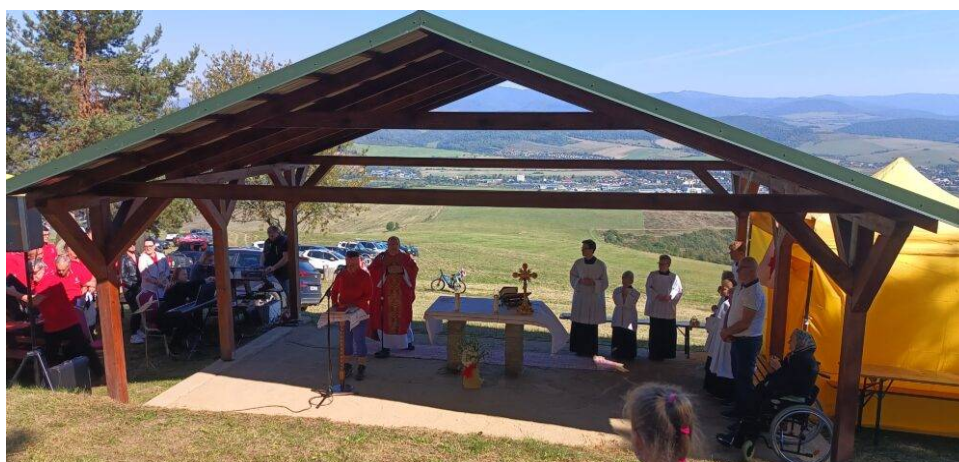
Sv. omša na Bukovej hore