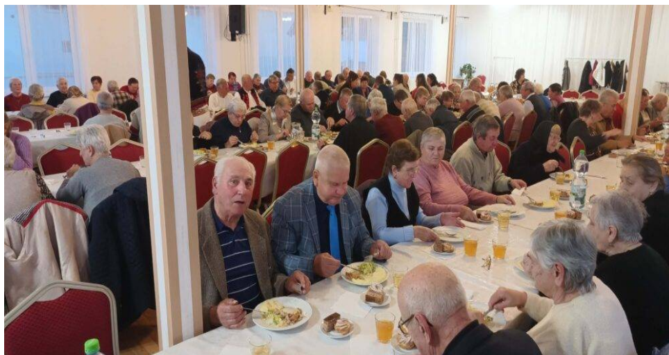
Mesiac Úcty k starším