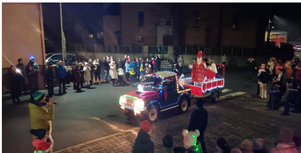
Stretnutie s Mikulášom

V obci sú zriadené dve folklórne súbory : MSS-Dubovičan, ŽSS-Dubovičanka a občianske združenie Dubovičan, ktorému obec poskytuje dotácie na základe VZN a Dohody o poskytnutí dotácie.