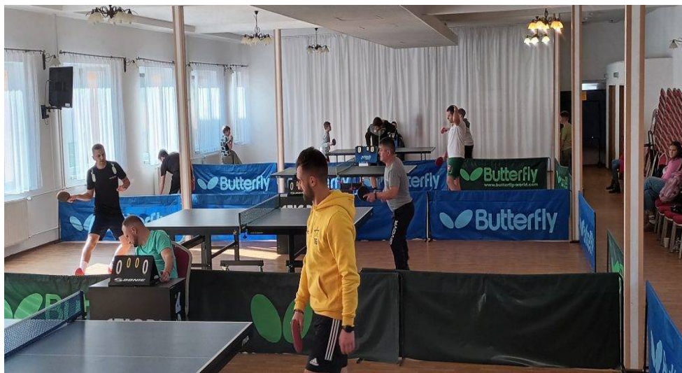
Majstrovstva Dubovice v stolnom tenise