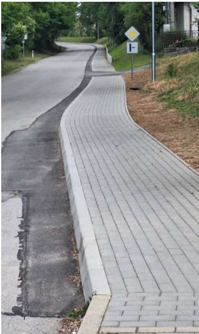
Chodník smer Melčice – Lieskové