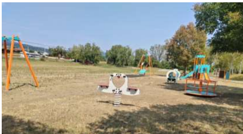
Detské ihrisko

V roku 2024 obec Ivanovce použila kapitálové výdavky predovšetkým na rekonštrukciu strechy na Dome smútku v sume 5 381,64 €, rekonštrukciu kotolne v Kultúrnom dome v sume 4 614,41 €, vybudovanie nového detského ihriska pri futbalovom ihrisku v sume 45 804,30 €, rekonštrukcia kotolne na bytovom dome č. 304 v sume 31 906,60 €, dobudovanie chodníka do obce Melčice – Lieskové v sume 112 518,57 €, rozšírenie obecného rozhlasu v sume 8 774,00 €.