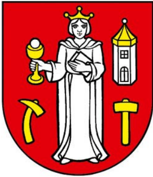
Erb mesta Krompachy