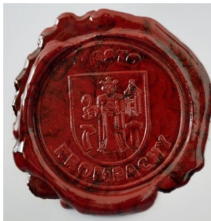
Pečať mesta Krompachy