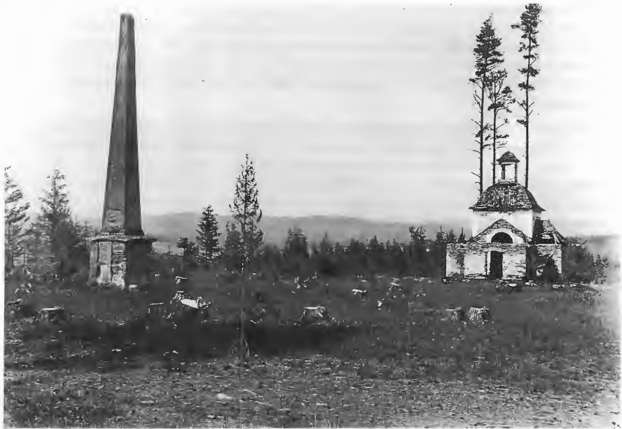
Areál Sans Souci v roku 1932