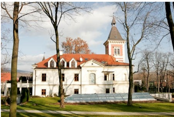
Pálffyho kaštieľ - Barokový kaštieľ z roku 1776, v roku 1884 bol prebudovaný.

Kráľovský Les - Existenciu Kráľovského lesa (Königswald, Baumwald, Baurvaldov háj, Pan-Vald, Panholský háj, Bahnwald) dokumentuje presnejšie doklad z roku 1615, keď kráľ Matej II. potvrdil a vydal listinu palatína Juraja Thurzu, v ktorej sa určili chotárne hranice mestečka Pezinka a pezinského hradu, kde je spomínaný „ istý náš hájený les (od quandamsyluamnostramprohibiticiam), ktorý oddeľuje klčoviská na území pezinských mešťanov “.