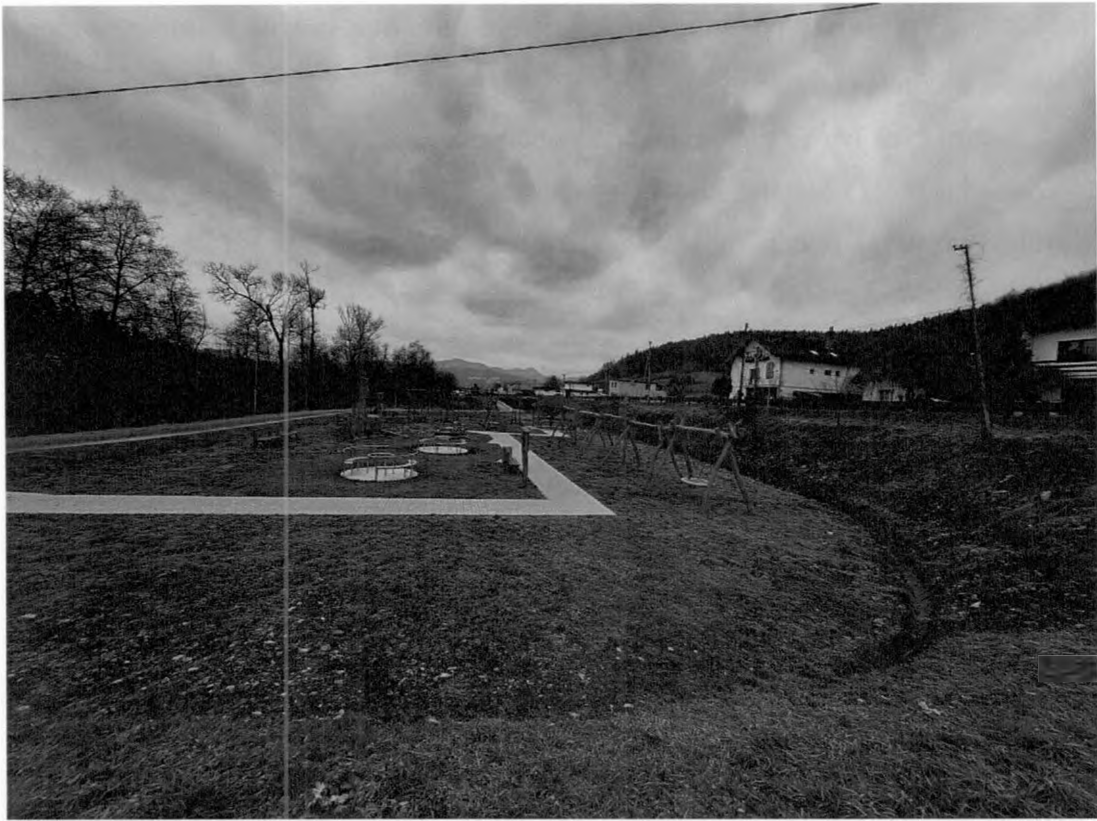
Prístrešok pri altánku