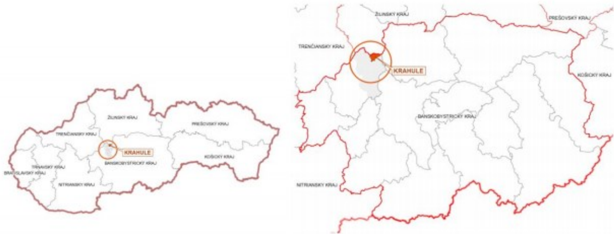
Obrázok: Poloha obce v rámci Slovenska a v rámci kraja

Horská obec Krahule leží na strednom Slovensku v centrálnej časti Kremnických vrchov. Je rozložená popri ceste od severozápadu smerom k juhovýchodu. Stred obce je vo výške 872 metrov nad morom, pričom najvyššia nadmorská výška je 1 060 m.n.m. Obec je 1 000 m dlhá a 150 m široká. Obec zaberá približne 15 ha a celková plocha chotára je 1076 ha. Chotár má tvar trojuholníka, kde kratšiu stranu tvorí línia od Trnovníka (989 m nad morom) po Krahulský štít (958 m nad morom) a meria asi 3 km. Vrchol trojuholníka je od tejto spojnice vzdialený približne 7 km východne v lese asi 1 km pred Skalkou (1 232 m nad morom).