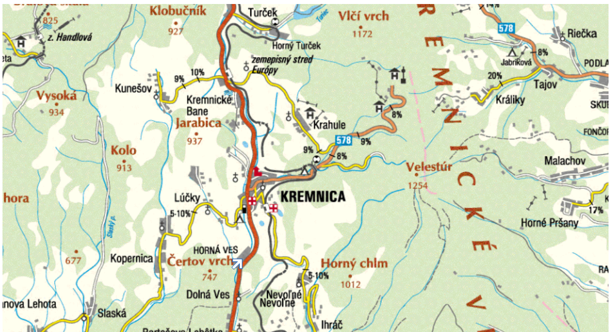
Obrázok: Poloha obce v rámci mikroregiónu „Kremnica a okolie“