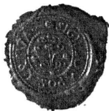
Odtlačok obecného pečatidla z r. 1842