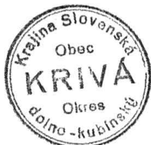
Odtlačok pečate obce z r. 1935