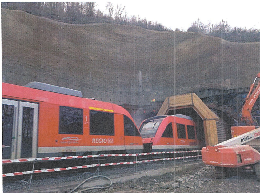
ARGE Cramberger und Fachinger Tunnel

Audit účtovnej závierky za rok 2023 vykonala audítorská spoločnosť EKONAUDIT SERVICES, s.r.o., Nálepkova 47, 05311 Smižany, zapísaná v obchodnom registri Okresného súdu Košice I., v odd. Sro, vložka číslo: 26015/V, Licencia SKAÚ 400.