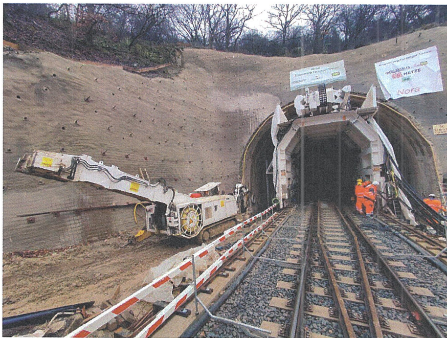
ARGE Cramberger und Fachinger Tunnel