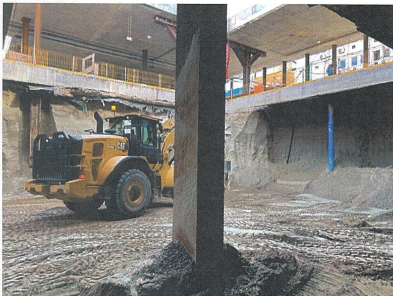
Tunnel Hauptbahnhof München

Spoločnosť vykázala kladný hospodársky výsledok, zisk vo výške 127.884,85 €