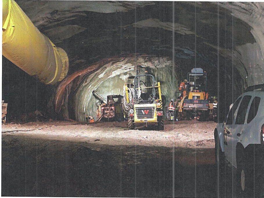
Projekt PSW FORBACH

STI, spol. s r.o. je spoločnosťou na stavebnom trhu, ktorej história sa píše už viac ako 30 rokov. Dlhými rokmi práce sa vyprofilovala na stabilnú spoločnosť, ktorej výsledky sú viditeľné doma aj v zahraničí. STI, spol. s r.o. dnes predstavuje moderne riadenú firmu, ktorej základom sú jej ľudia.