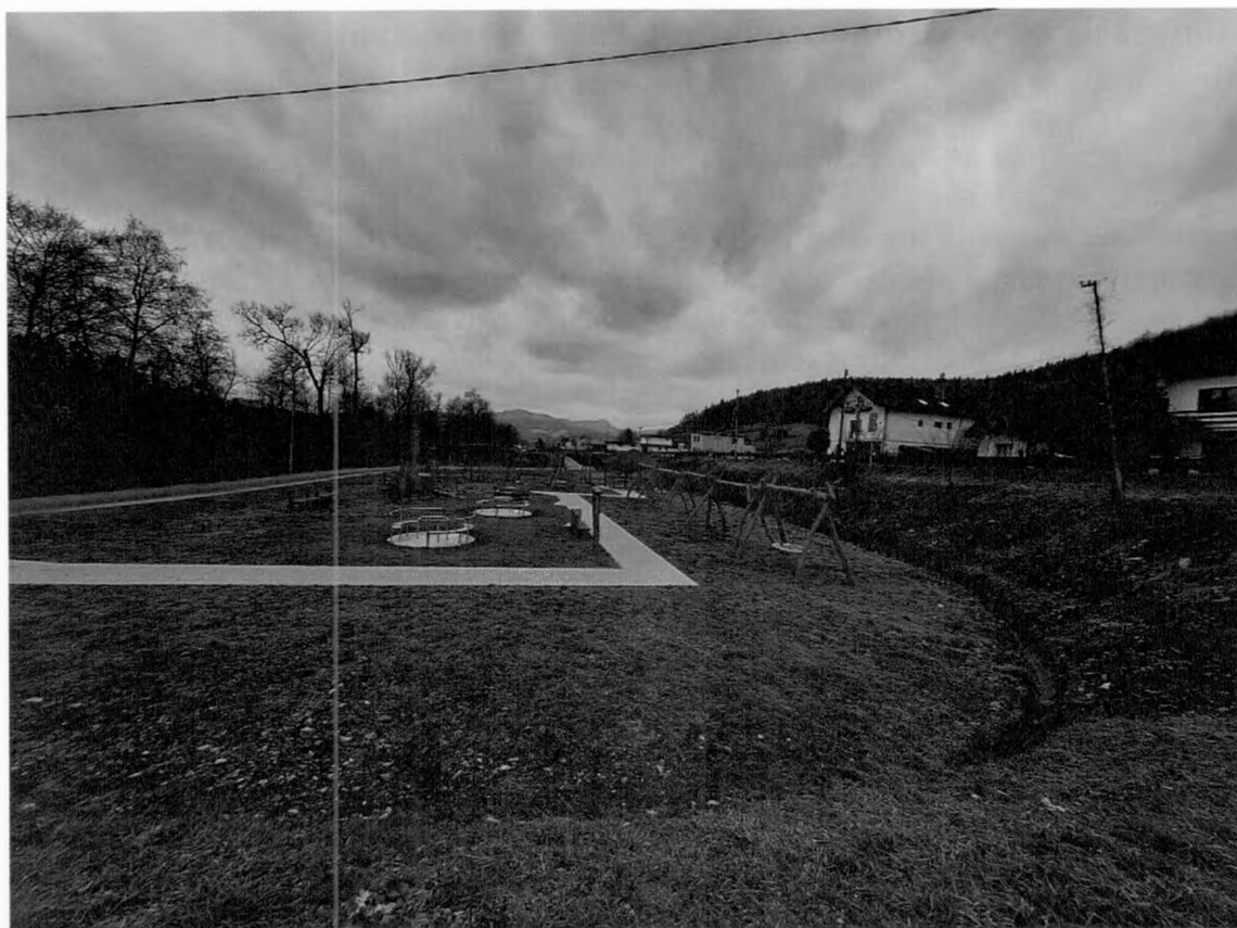
Prístrešok pri altánku