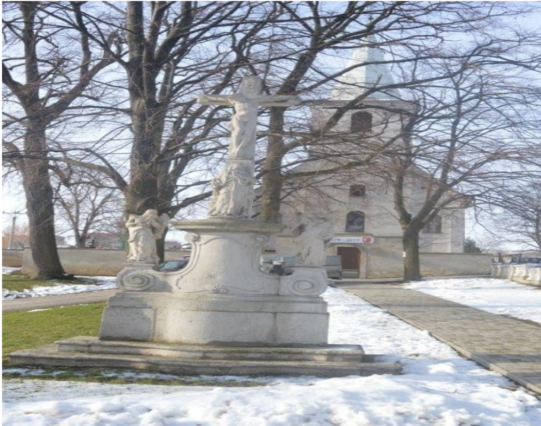
Socha sv. Floriána