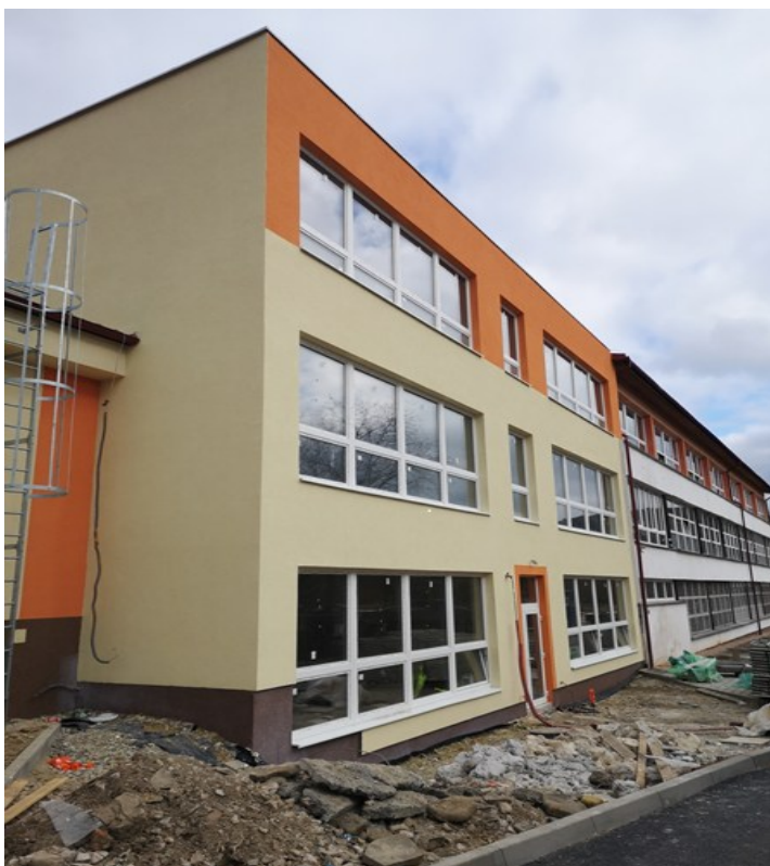
Prístavba k ZŠ s MŠ