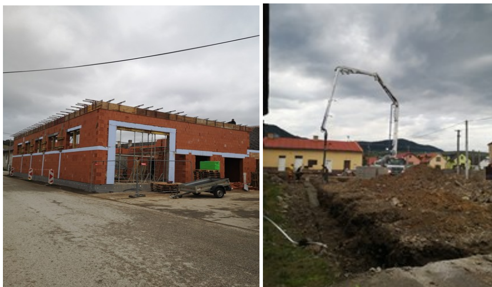
Garáž vozidiel údržby

- realizácia výstavby Garáž vozidiel údržby obce Jakubany vo výške 153 550,06