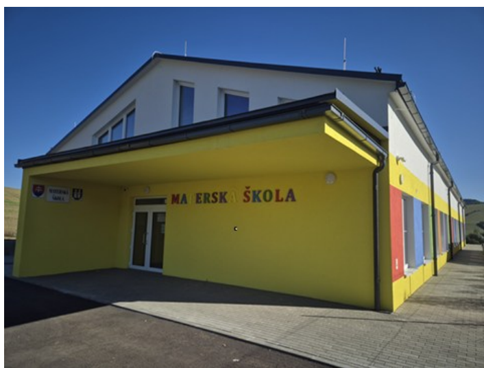
Budova MŠ /elokované pracovisko

- výstavba novej budovy materskej školy – elokované pracovisko v rómskej osade vo výške 1 005 624,10€