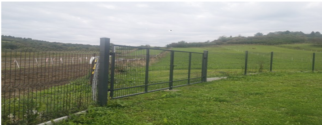
Oplotenie s bránou – zadná časť