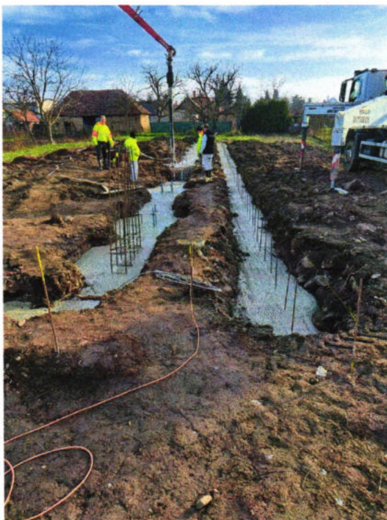
Začiatok výstavby Denného stacionára v obci Starý Tekov

Na základe doterajšieho vývoja možno očakávať, že rozvoj sociálnych služieb sa ďalej bude orientovať na opatrovateľskú službu . MPSVaR SR schválilo projekt vypracovaný Obcou Starý Tekov na vybudovanie denného stacionára a následne bola poskytnutá dotácie na jeho výstavbu v decembri 2024. Obec začala s výstavbou Denného stacionára v decembri 2024 a to s vybudovaním základov .