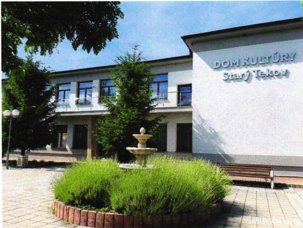
Budova Domu kultúry Starý Tekov