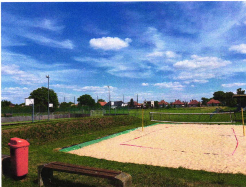
Športový areál – beachvolejbalové ihrisko