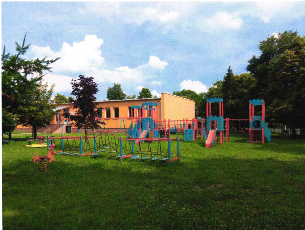
Budova Materskej školy Starý Tekov