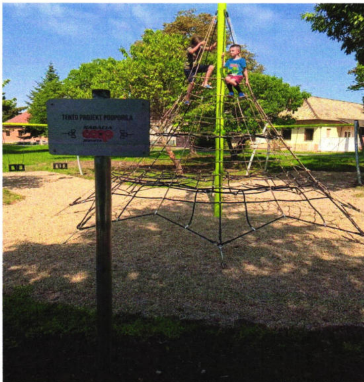
Detské ihrisko na námestí v parku 9.mája