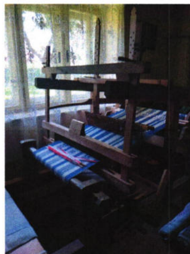
Tkáčsky stav v Ľudovom dome