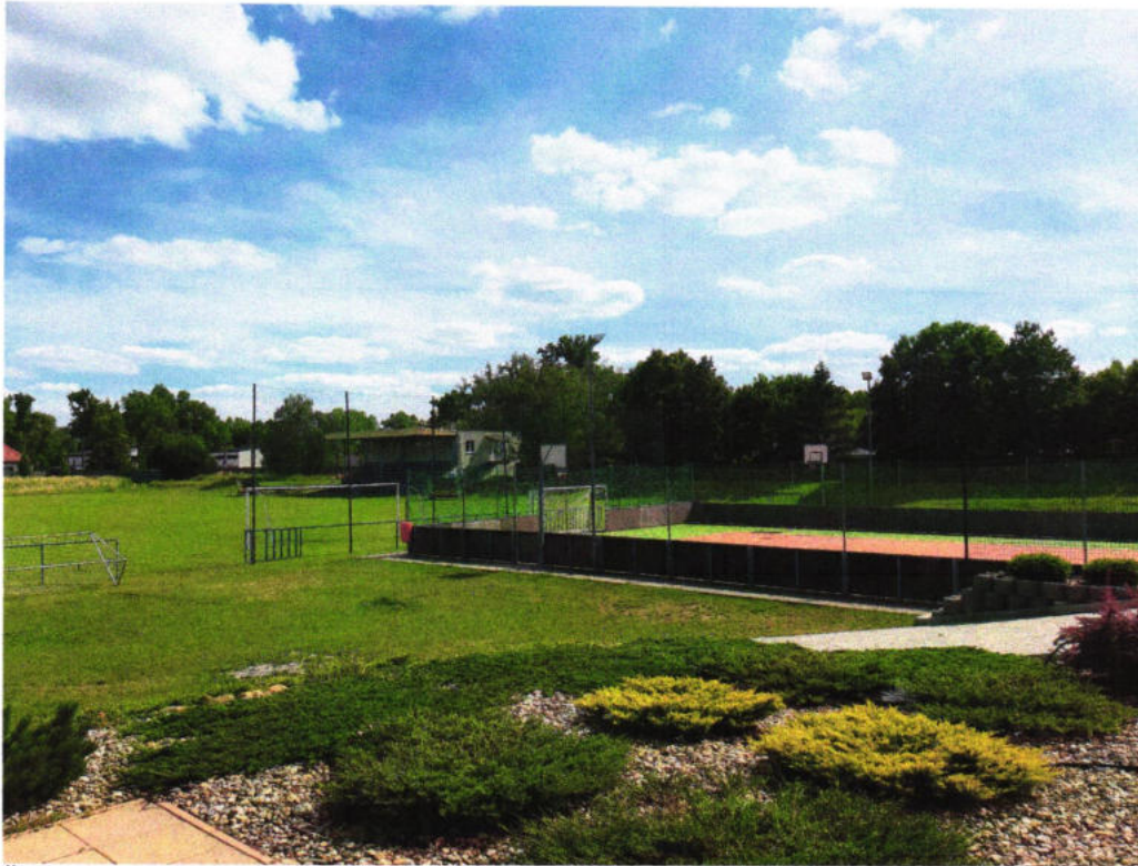
Športový areál – futbalové ihrisko, vpravo multifunkčné ihrisko