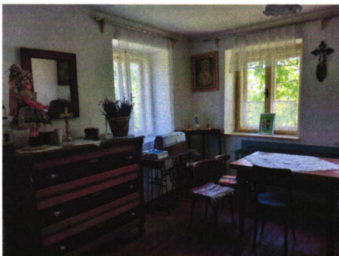
Ľudový dom v Starom Tekove