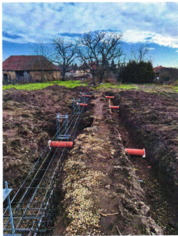
Novostavba Denného stacionára