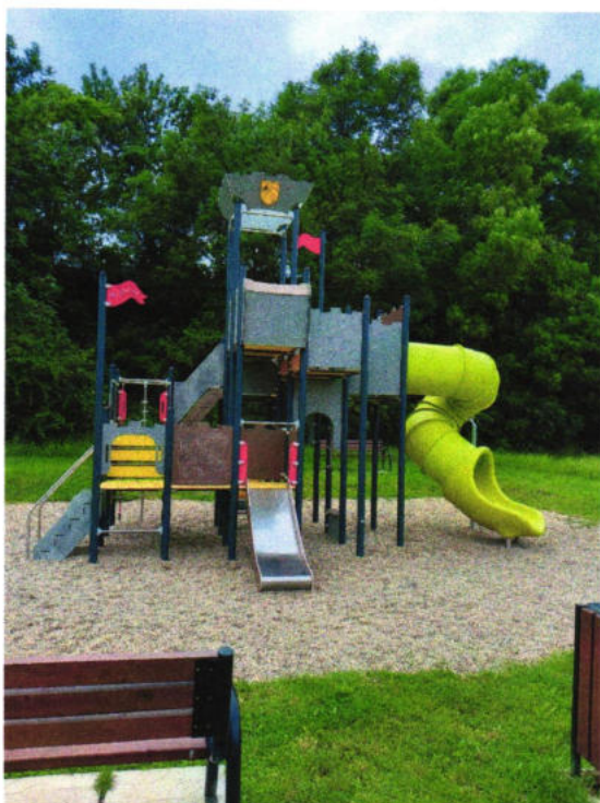
Detské ihrisko- Hrad s tobogánom pri Mlyne