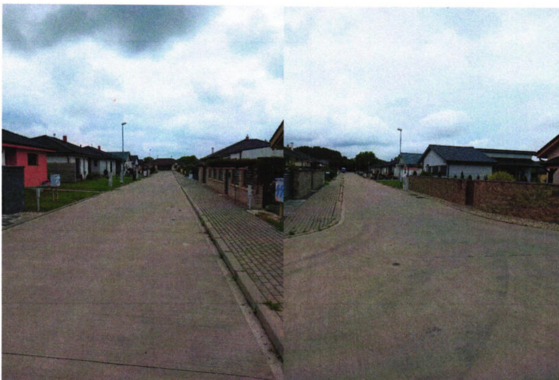
Prebiehajúca individuálna bytová výstavba na vytvorenej IBV – Vranie diely (podľa schválených zmien a doplnkov č.1 k ÚPN obce Starý Tekov)

V roku 2022 bol vypracovaný návrh Zmien a doplnkov č.2 k ÚPN Obce Starý Tekov k doplneniu plošnej rezervy bývania formou IBV.