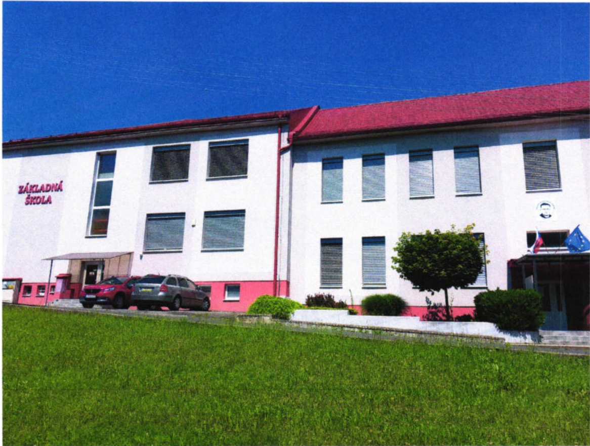
Budova Základnej školy Štefana Senčíka Starý Tekov