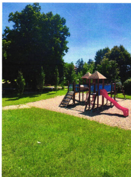
Detské ihrisko s preliezkami pri ZŠ