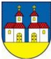
Erb obce :