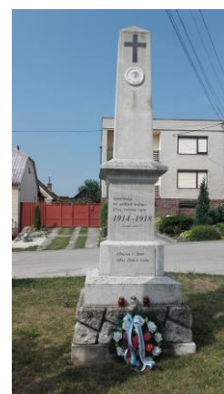
Pomník padlým v I. svetovej vojne