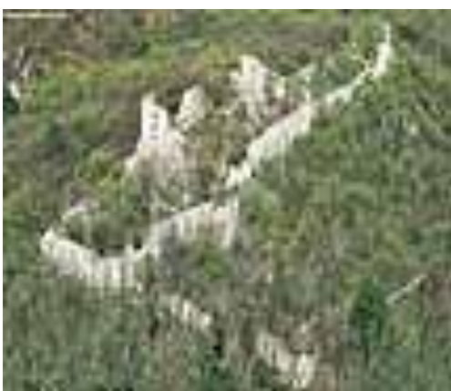
Dobrovodský hrad – zrúcanina