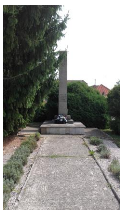
Pomník padlým v II. svetovej vojne