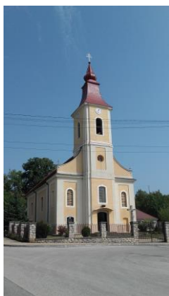
Kostol narodenia Panny Márie