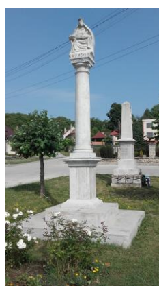
Pomník Sedembolestnej Panny Márie Šaštínskej