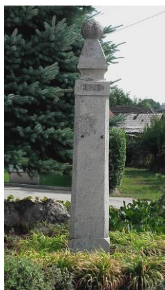
Pranier – stĺp hanby