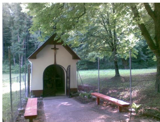
Kaplnka Najsvätejšej Trojice pod Mariášom