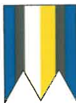
• Obecná vlajka