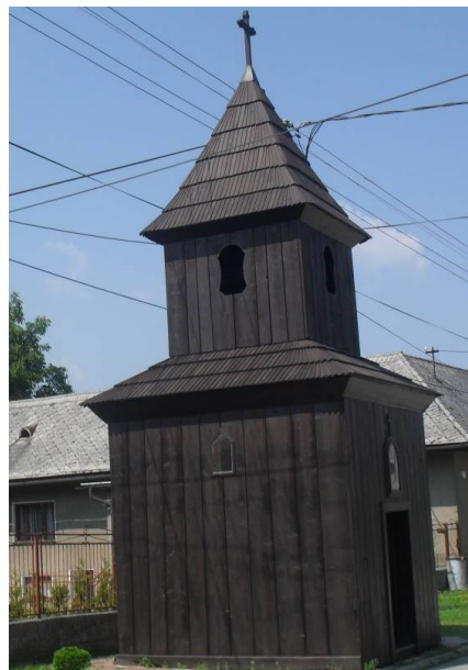
Obrázok č. 3: Drevená zvonica z prvej polovice 19. storočia

Drevená zvonica so štvorcovým pôdorysom a v stavanou vežou, šalovaná, debnená, s nadstavcom, vysadenou izbicou a ihlanovou strechou bola postavená v polovici 19. storočia. Vo výklenku bola v minulosti ľudová socha, kópia Piety z Tužiny z 1. polovice 19. storočia. Vo veži je zvon z roku 1783, ktorý je od roku 2010 v zozname národných kultúrnych pamiatok. V obci je niekoľko kamenných sypární a drevených krížov z 20. storočia.