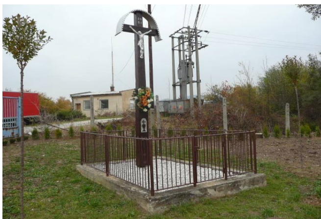
Obrázok č. 5: Obnovený drevený kríž (pri býv. družstve)