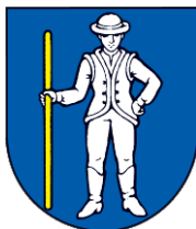
Obrázok č. 1: Erb obce Lipník

Súčasný erb obce vychádza z historickej pečate Lipníka a zobrazuje v modrom štíte stojaceho striebroodetého muža v klobúku, v čižmách, s ľavou rukou vbok a v pravicu drží dlhú zlatú palicu (pravdepodobne predstavuje gazdu alebo richtára).