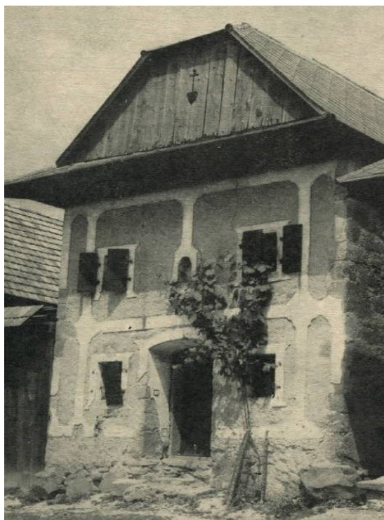
Obrázok č. 4: Kamenná sypáreň (pri dome č. 78)