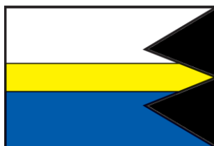
Obrázok č. 2: Vlajka obce Lipník

Vlajka obce je bielo-žlto-modrá s pomerom strán 2:1:2 a ukončená je rovnomerným trojcípovým chvostom.