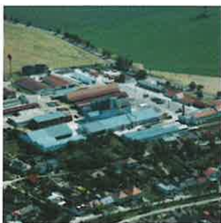
PVOD Kočín so sídlom v Šterusoch

Kľúčovým zamestnávateľom je Poľnohospodársko-výrobná-obchodná družstvá Kočín so sídlom v Šterusoch, v ktorom pracuje asi 65 ľudí.