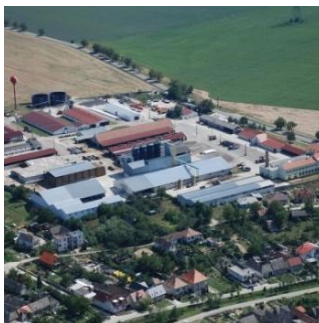
PVOD Kočín so sídlom v Šterusoch

Kľúčovým zamestnávateľom je Poľnohospodársko-výrobnobchodné družstvo Kočín so sídlom v Šterusoch, v ktorom pracuje asi 65 ľudí.