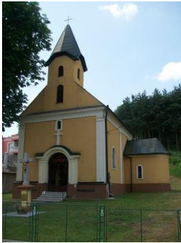
Kostol rímsko-katolícky postavený v roku 1897 v historizujúcom slohu