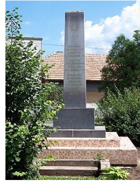
Pomník Sovietskej armády