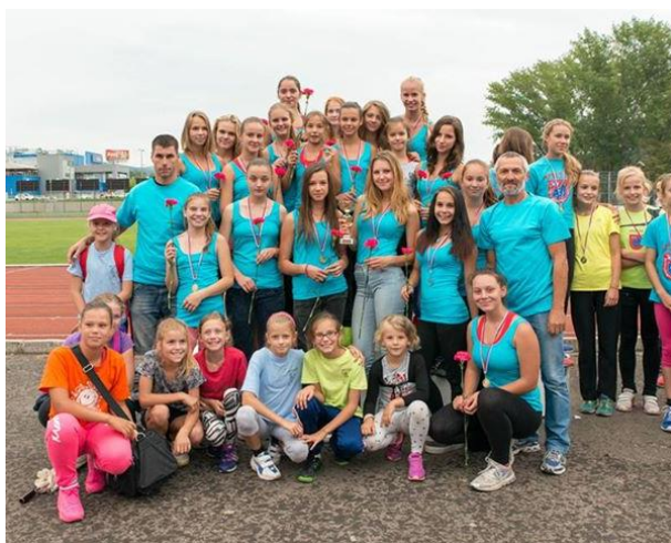
Obr. č. 8

Klub má aj stránku na facebooku: https://www.facebook.com/akbojnicky/