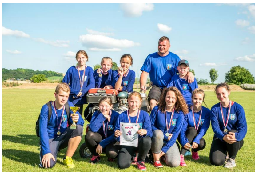
Obr. č. 11

DHZ Bojničky aj v tomto roku zapojila do Detskej západoslovenskej hasičskej ligy, kde sme mali jedno dievčenské družstvo. Dievčatá sa zúčastnili ôsmych hasičských kôl, ktoré pozostávali zo štafety a útoku s motorovou striekačkou. V celkovom poradí sa umiestnili na 6. mieste z deviatich. Taktiež aj ženy sa zapojili do Západoslovenskej hasičskej ligy, v ktorej súťažili len v útoku s motorovou striekačkou, ktoré sa z desiatich kôl umiestnili na 7. mieste z deviatich. krásnymi umiestneniami.