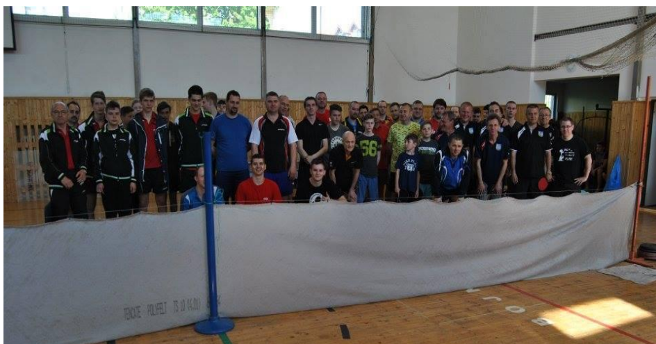
Obr. č. 10

Celkovo reprezentovali Bojničky v mužskej kategórii 26 hráčov a v žiackej 24 hráčov.