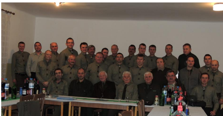
Obr. č. 9