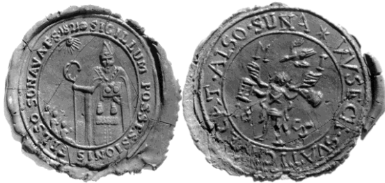
Obecné pečate z 19.storočia