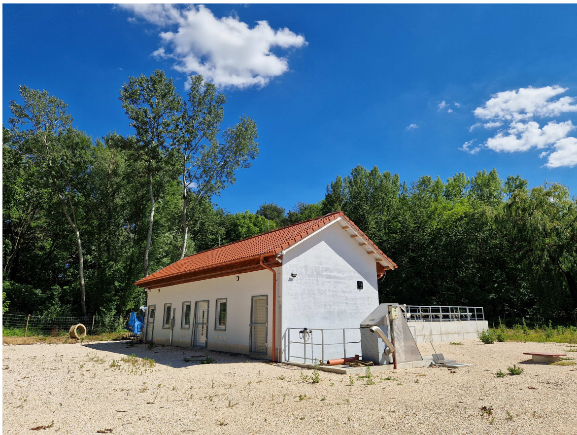
Čistička odpadových vôd