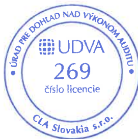
Zodpovedný audítor Bart Waterloos Licencia UDVA č. 1029

CLA Slovakia s.r.o. Karpatská 8 811 05 Bratislava Obchodný register, zložka 74698/B Licencia SKAU č. 269