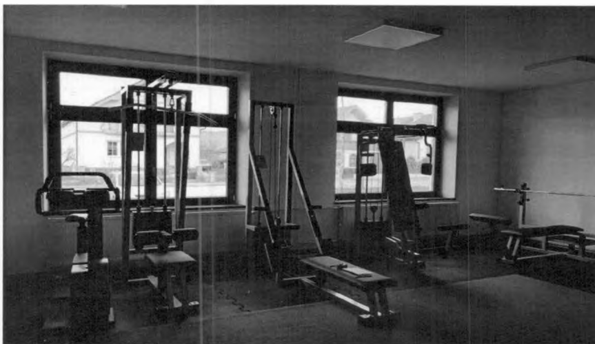
Hasičská zbrojnica a garáž vybudovaná v r. 2018