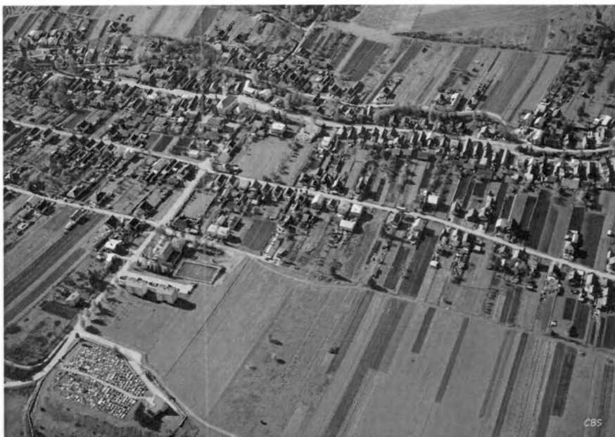
Obecný úrad Kónská