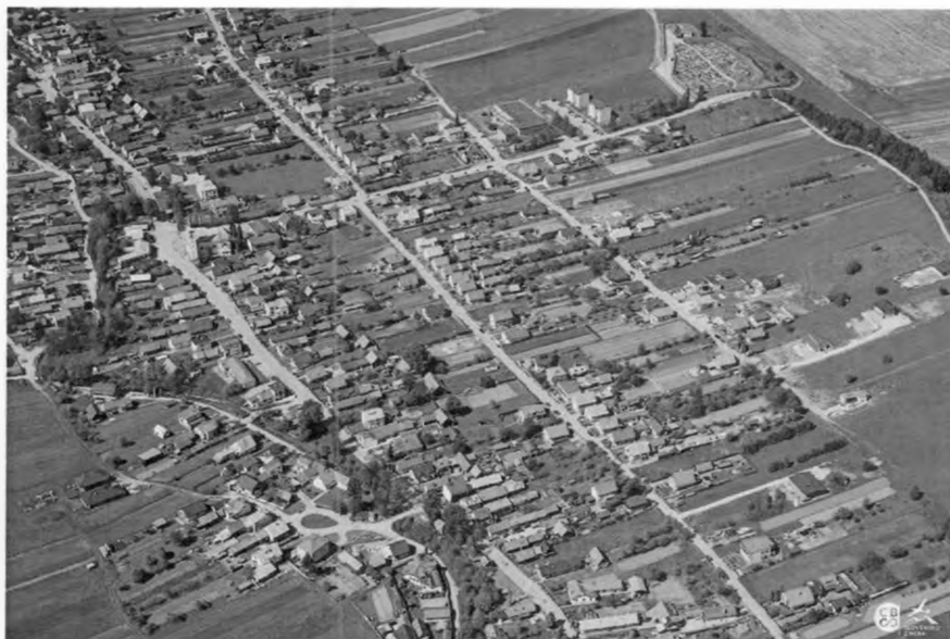
Konsolidovaná výročná správa obce Korská a jej RO - ZŠ s MŠ za rok 2024