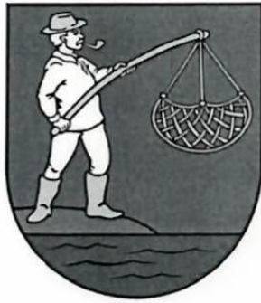
Erb obce :