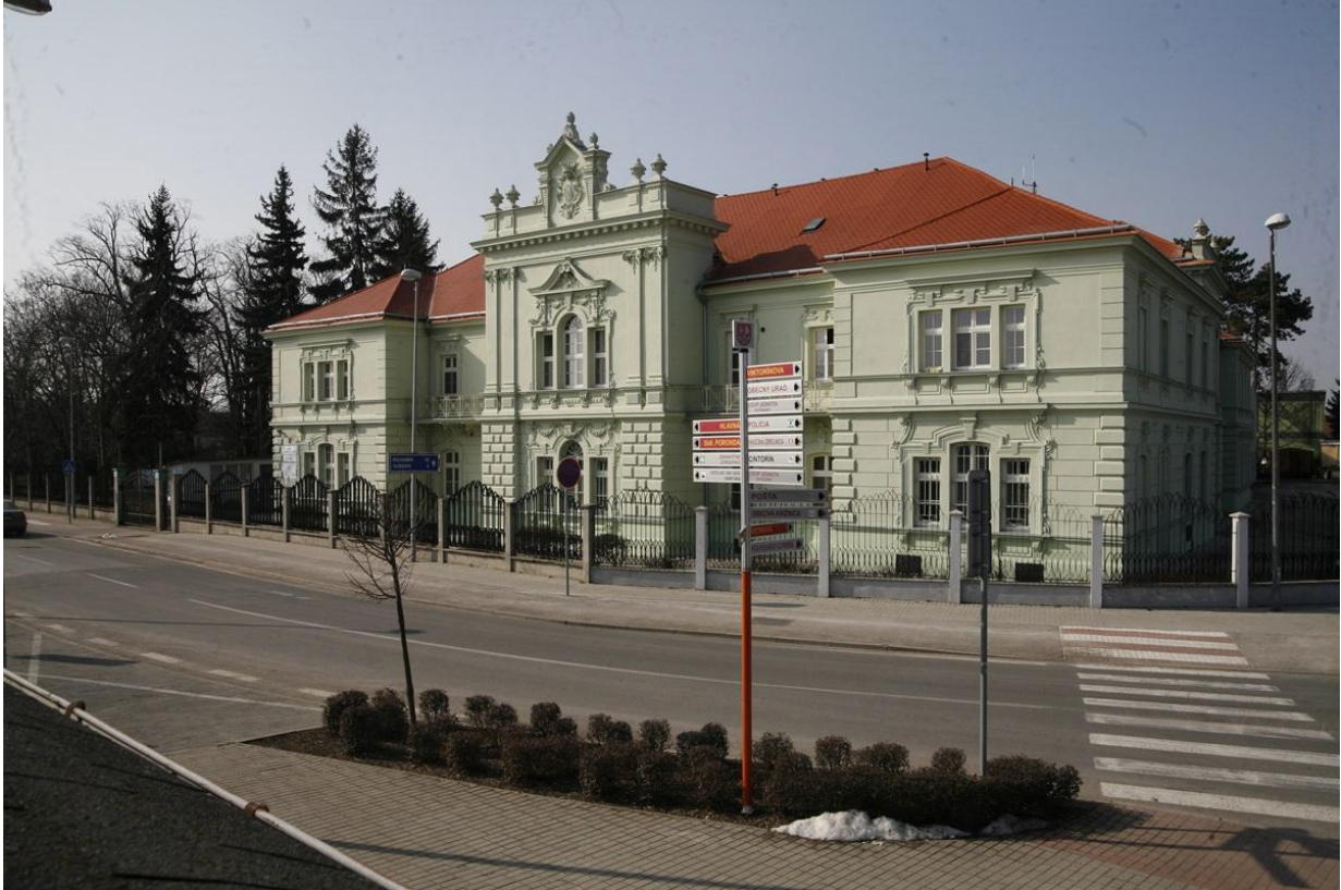
Kaštieľ rodiny Majláthovcov zo začiatku 19. storočia, dnes Domov sociálnych služieb pre dospelých v správe VÚC Trnava

Medzi kultúrne pamiatky patrí kaštieľ rodu Majláthovcov spolu s parkom.