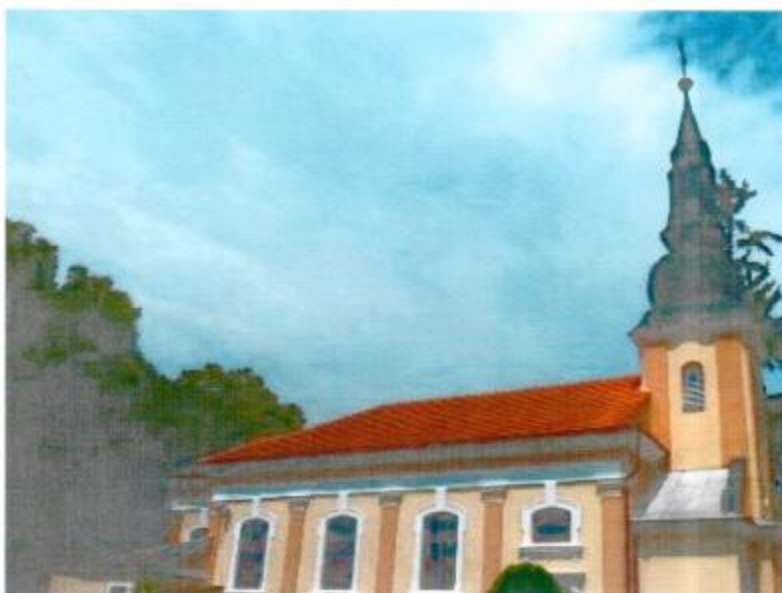
Kostol sv. Imricha