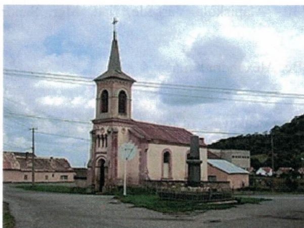
Evanjelický kostol tu stojí od roku 1901.