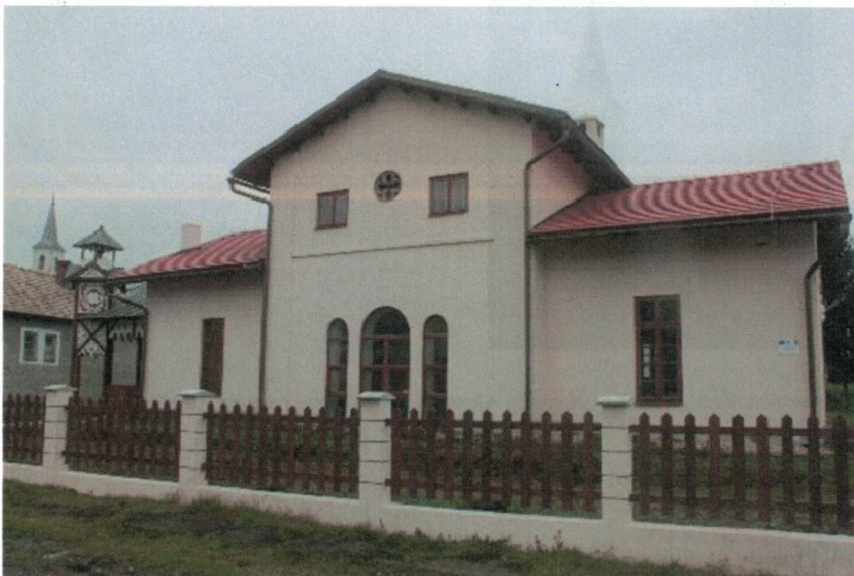
Múzeum regiónu Údolie Gortvy