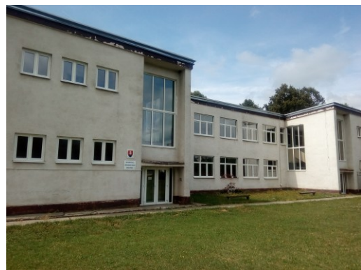
Základná škola v Novej Bošáci