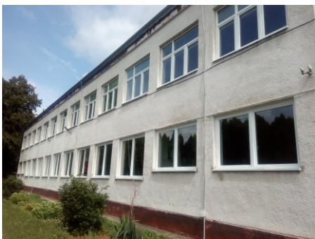
Materská škola v Novej Bošáci