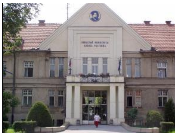
Obr. 23 Univerzitná nemocnica Louisa Pasteura

Francúzsky park je zvláštnosťou Univerzitnej nemocnice Louisa Pasteura na Rastislavovej ul. od jej založenia od r. 1924. Vyše 90 – ročná záhrada UNLP patrí k územiám s najvyšším stupňom ekologickej stability, je označovaná za pľúca Košíc a vytvára mikroklimu južnej časti mesta. Historický park UNLP Košice je posledný nemocničný udržiavaný starý francúzsky park na Slovensku.