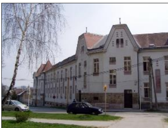
Obr. 22 Budova Strednej zdravotníckej školy