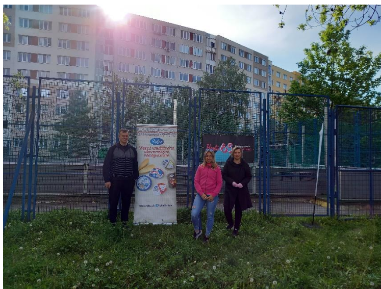
Obr. 12 Barbie upravljuje Slovenijo