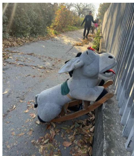
Obr. 9 Upratovanie Južná trieda s Civas Save Natur