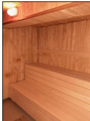
Obr. 54 a 55 Relaxačný bazén s vírivkami a sauna