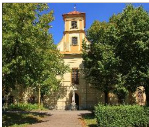
Obr. 19 Kostol Ducha svätého

Južná časť mesta sa začala formovať v období rozvoja obchodu ako prirodzené pokračovanie historického centra. Okolo vlastného územia stredovekých Košíc existovali menšie územné celky – prímestské osady, ktoré sa až do začiatku 16. storočia označovali ako villa, dorff, vicus, dörrfel. Na juhovýchodnom predmestí sa rozprestierala Ludmanova Ves (villa Ludmani, resp. Ludmansdörrfel) i Špitálska ulica; v juhozápadnej časti Bednárska Ves (Bindersdorf, či Bindergass).