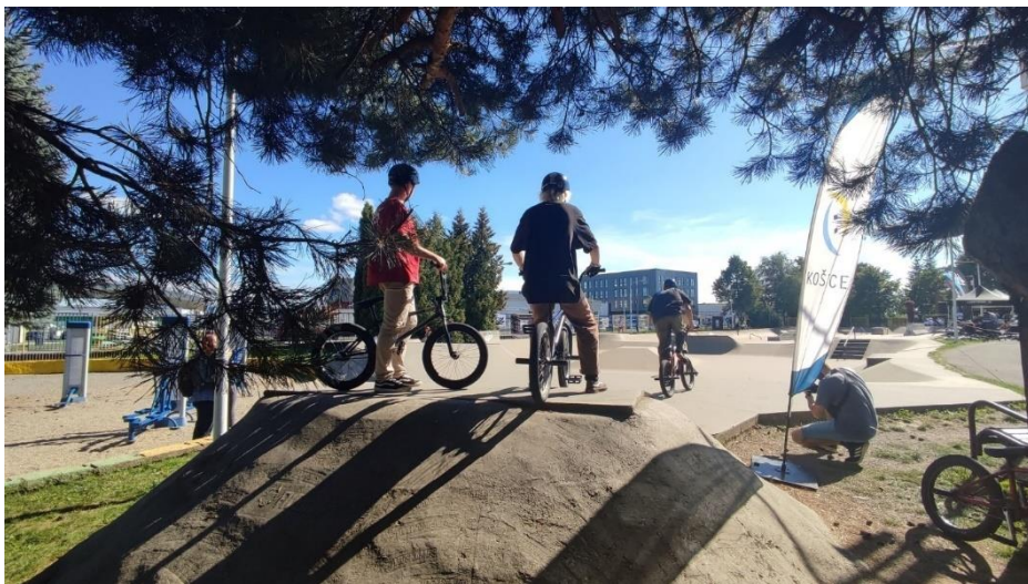
Obr. 66 Skate park

Skate park: výstavba skate parku pre všetkých milovníkov tohto športu bola realizovaná v rokoch 2008 až 2009 a hneď od uvedenia do prevádzky si našiel svojich stálych športových nadšencov a návštevníkov.