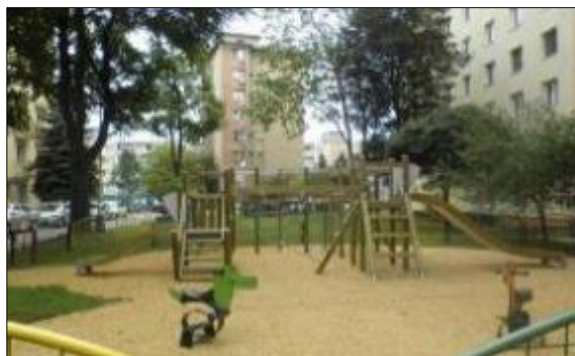
Obr. 47 Detské ihrisko Safari