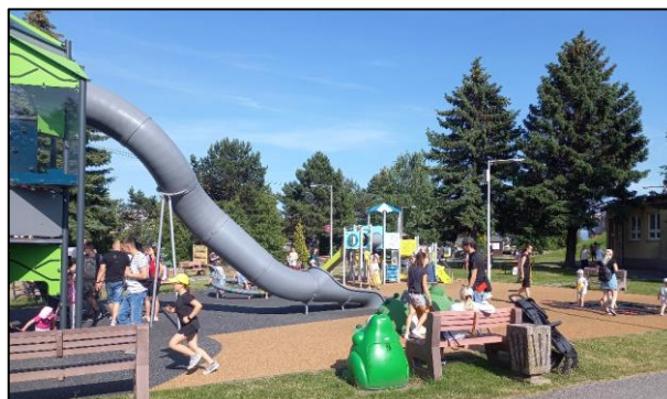
Obr. 69 Detské ihrisko