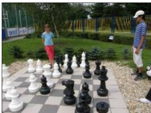
Obr. 68 Exteriérové šachy

Atrakcie areálu: hovoriaca lavička, stroje na cvičenie, 3D maľba draka, exteriérové šachy, ruské kolky, človeče nehnevaj sa, altánok a veľa ďalších skvelých možností trávenia voľného času pre všetky vekové kategórie. Fanúšikovia cvičenia na čerstvom vzduchu radi využívajú cvičenia v exteriérovej posilňovni. V roku 2019 pribudlo niekoľko nových zábavných atrakcií: pre deti sme namaľovali interaktívny skákací chodník, na ktorom si užijú mnoho zábavy. Veľkej obľube sa teší 18 metrová nafukovacia dráha a nafukovací hrad pre malé deti a pre starších návštevníkov aj petangové ihrisko. V závere roka 2020 areál zatriktívnilo nové detské ihrisko, jedinečné svojho druhu na východnom Slovensku. Veža ihriska sa nachádza vo výške 6 metrov a deti sa môžu zhora spustiť na dvoch šmykl'avkách. V roku 2021 sme doplnili areál aj o vodný prvok v podobe aquapaddlera – člnkovanie a o opičiu lanovú dráhu s rôznymi preliezacími prvkami. V roku 2022 pribudol aj šliapací kolotoč a bola dokončená druhá etapa detského ihriska pre deti od troch rokov s trampolínami a 3D zvieratkom - krokodíl.