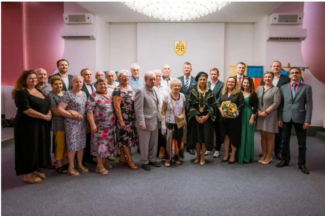
Obr. 26 Udeľovanie verejných ocenení

Kolektív Univerzitnej nemocnice L. Pasteura - pri príležitosti 100. výročia vzniku