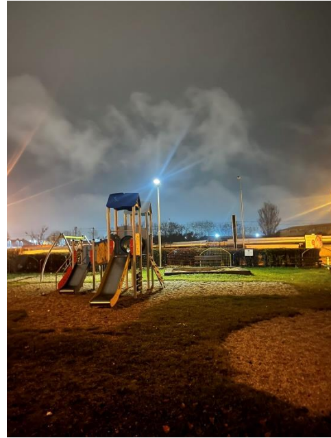
Obr. 7 a 8 LED osvetlenie Zborovská vnútroblok a detské ihrisko ulica Rosná