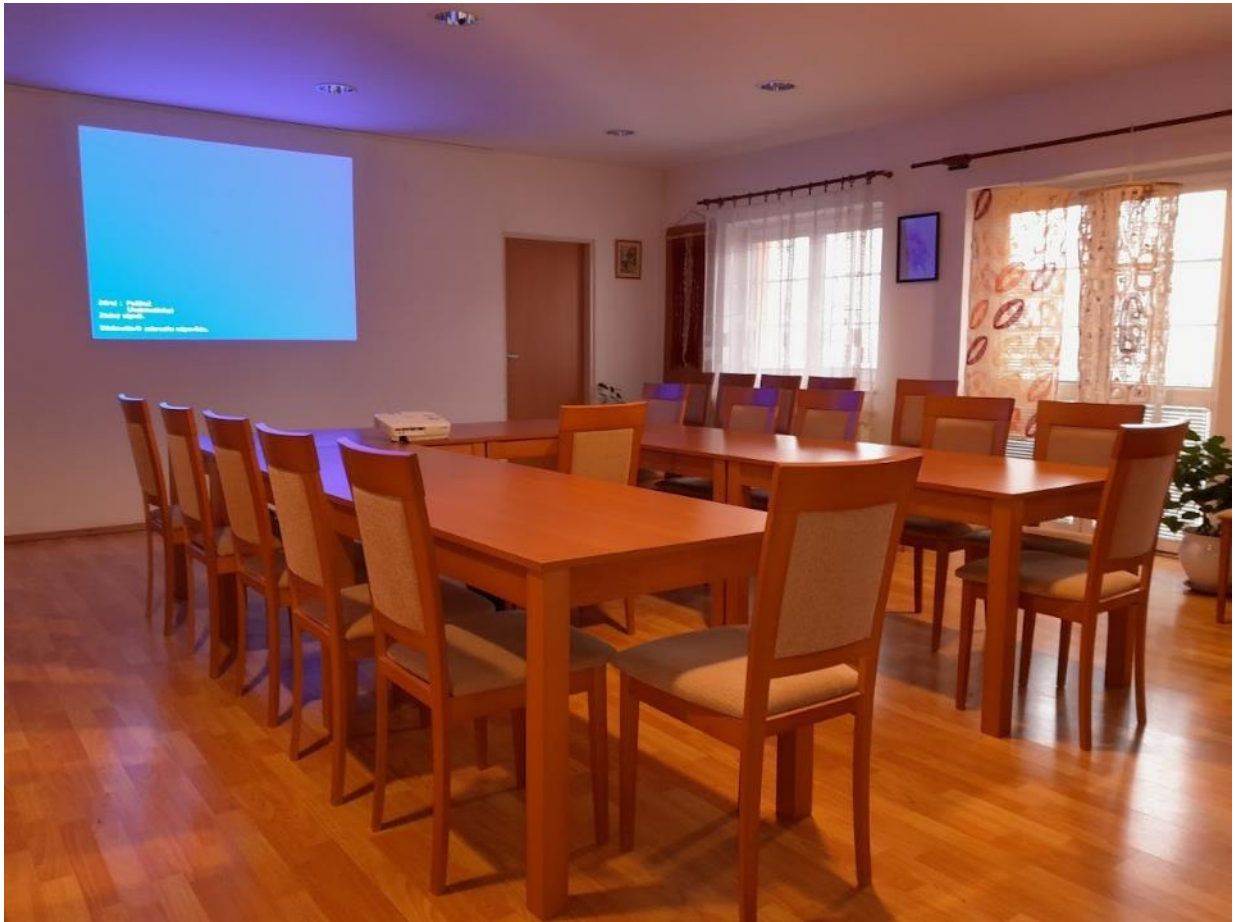
Obr. 53 Seminárna miestnosť Spoločensko – relaxačného centra

V roku 2020 a 2021 slúžili priestory Spoločensko – relaxačného centra na testovanie obyvateľstva na ochorenie Covid – 19. V roku 2021 sa zároveň podarilo kompletne zrekonštruovať oporné múriky terasy, vymenilo sa rozpadnuté zábradlie a balkóny hlavnej budovy prešli rozsiahlou sanáciou.