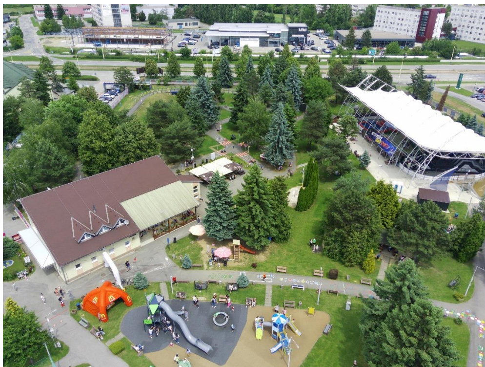
Obr. 57 areál ŠZA z vtačeľ perspektívy

Mestská časť Košice – Juh je vlastníkom a správcom Športovo - zábavného areálu na Alejovej 2 v Košiciach o rozlohe 22 546 m 2 , ktorý denne navštívi veľa detí, športovcov, občanov a návštevníkov mesta Košice. Areál je prispôsobený všetkým vekovým kategóriám – starší ľudia