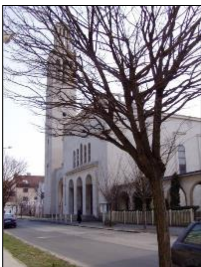
Obr. 20 Kostol Kráľovnej pokoja

Najstaršou známou stavbou na území terajšej mestskej časti je mestský špitál (hospitale, xenodochium) s kostolíkom sv. Ducha na Južnej triade, postavený v polovici 13. storočia. Barokový kostol, ktorý dnes tvorí centrum areálu pre seniorov, postavili v rokoch 1730 - 1733. Obraz hlavného oltára kostolíka s námetom zoslania sv. Ducha je od J. Mathausera a pochádza z roku 1894. Ďalším kostolom v tejto mestskej časti je rímskokatolícky kostol Kráľovnej pokoja, postavený v rokoch 1938 - 1939. Veža kostola je vysoká 32 metrov. Na Rastislavovej ulici sa nachádza Verejný cintorín. Oproti špitálu stál hostinec „U zeleného stromu“, ktorý sa spomína aj v súvislosti s košickou návštevou cisára Jozefa II. v roku 1770.