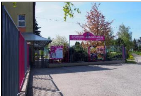
Obr. 67 Vstupná brána ŠZA

Budova areálu: v priestoroch budovy je návštevníkom k dispozícii bufet, detské hry, stolný futbal, tenis, mobilná knižnica a vonku letná terasa, na prvom poschodí sa pravidelne koná dopravná výchova pre deti spojená s premietaním po skončení dopravnej výchovy vedenej príslušníkmi polície. Budova sa dá prenajať k rôznym spoločenským podujatiam ako napríklad oslavy narodenín, detské tematické párty a podobne. Od roku 2016 si môžu návštevníci areálu zahrať v budove areálu billiard, air hockey, stolný futbal a šípky.