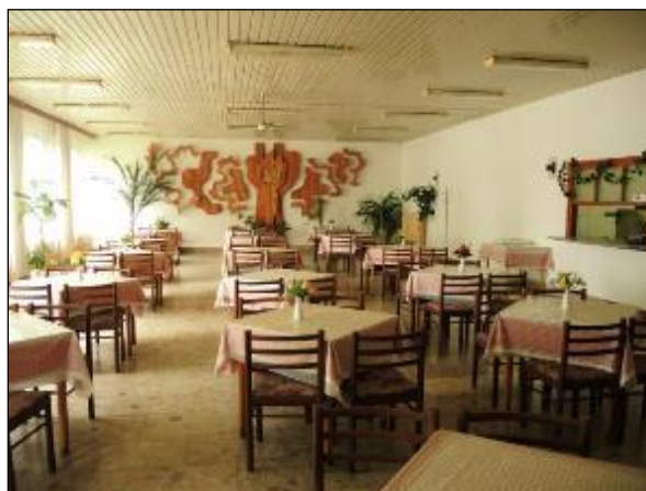
Obr. 34 Interiér Jedálne pre Dôchodcov pôvodný stav