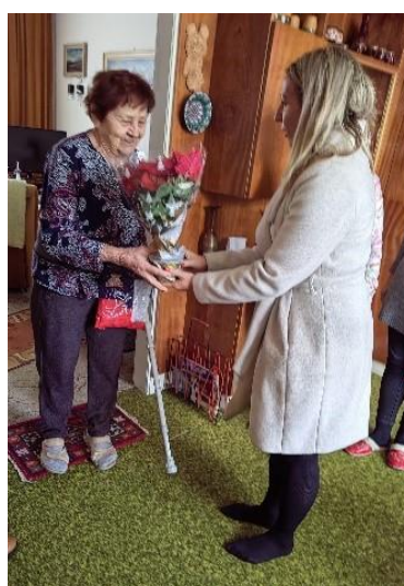
Obr. 2 a 3 Vianoční pomocníci - odovzdanie balíčkov želaní