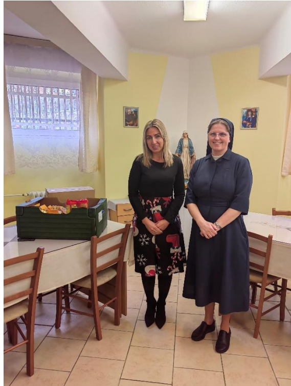
Obr. 32 Trvanlivé potraviny pre sestry Vincentky

Pre vybraných klientov OS boli v rámci akcie „Daruj kilečko“ pred Veľkou nocou pripravené a odovzdané balíčky s trvanlivými potravinami pre 48 seniorom. Časť zo zbierky potravín bola odovzdaná sestrám Vincentkám, ktoré pripravujú jedlo pre ľudí v núdzi v MČ Košice- Juh. V decembri 2024 sa pre 98 klientov OS pripravili v rámci projektu “Vianoční pomocníci 2024“ balíčky podľa prání samotných klientov, ktoré im boli aj odovzdané.