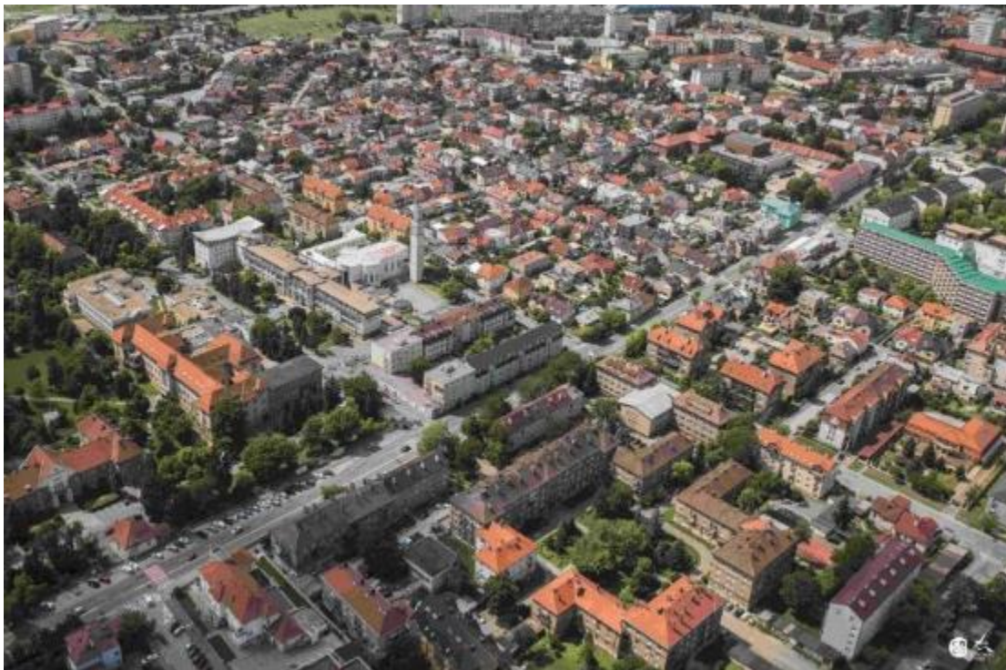
Obr. 17 Pohľad na MČ Košice – Juh z vtácej perspektívy