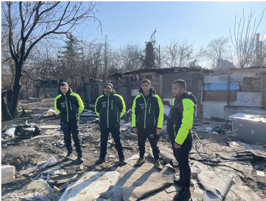
Obr. 4 Členovia MOaPS MČ Košice - Juh