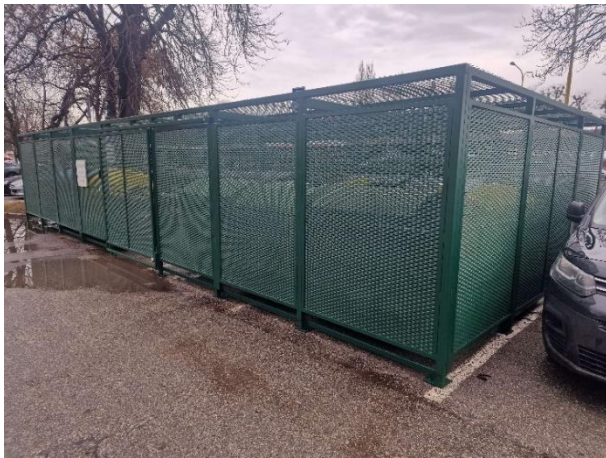
Obr. 5 Kontajnerovisko Jantárová