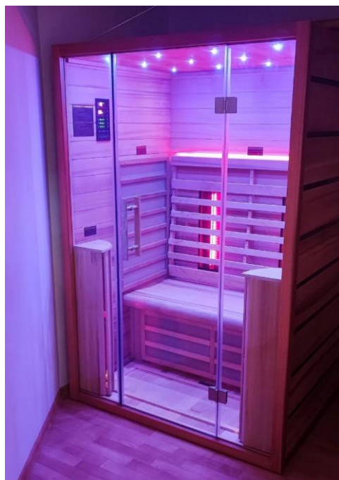
Obr. 56 Infrasauna

V roku 2023 pribudla k novinkám v rámci poskytovania služieb infrasauna.