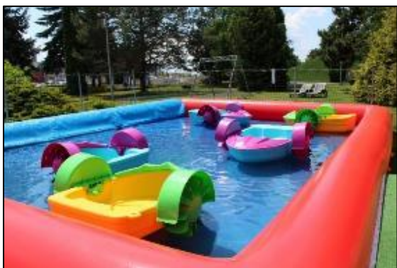
Obr. 70 Vodné atrakcie - člnkovanie