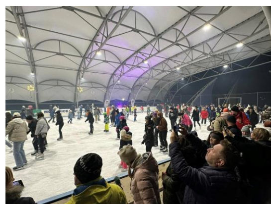
Obr. 63 NON STOP 24 - hodinové korčuľovanie