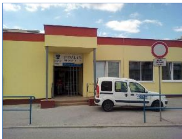
Obr. 35 a 36 Jedáleň pre dôchodcov, Vojvodská 5 po rekonštrukcii v roku 2016

Počet predaných stravných lístkov v roku 2024 s priznaným účelovým finančným príspevkom mesta Košice na stravovanie dôchodcov bol 50976 ks a celková suma účelového finančného príspevku mesta Košice na stravovanie dôchodcov za rok 2024 činila pre dôchodcov MČ Košice – Juh sumu 101952 eur.