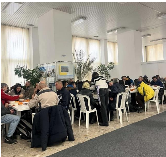
Obr. 42 a 43: Vianočná kapustnica pre ľudí bez domova v priestoroch MČ Košice - Juh