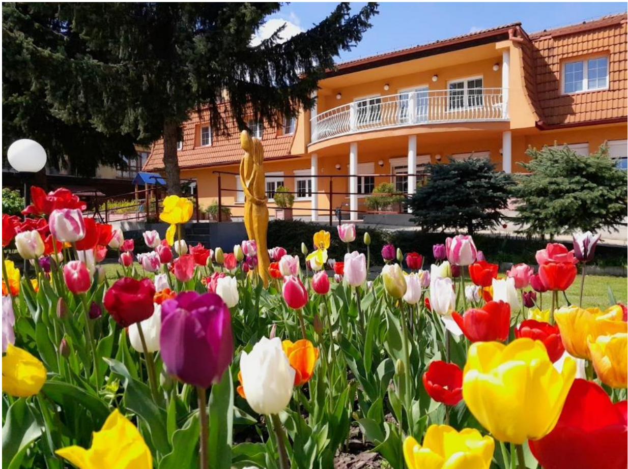
Obr. 52 Budova Spoločensko-relaxačného centra, Milosrdenstva 4

Denné centrum seniorov tak plní požiadavky občanov v oblasti záujmovej, kultúrnej a športovej činnosti, v snahe udržiavania fyzickej a psychickej aktivity občanov, ktorí sú poberateľmi starobného dôchodku alebo občanov s nepriaznivým zdravotným stavom.