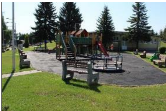
Obr. 58 Pôvodné detské ihrisko

V Zmysle zmluvy o spolupráci medzi Mestskou časťou Košice – Juh a Deutsche Telekom Systems Solutions Slovakia s.r.o. sa zmluvné strany dohodli od roku 2020 na zmene názvu areálu na #MAGENTALIFE Športovo - zábavný areál a v roku 2024 na zmene názvu areálu na Športovo – zábavný areál.