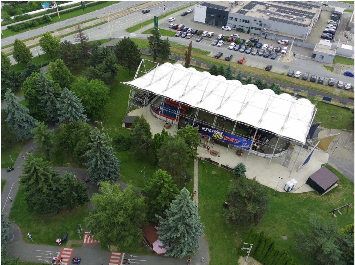
Obr. 15 Prestrešenie ľadovej plochy na ŠZA