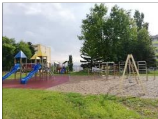
Obr. 44 Detské ihrisko Železníček-Nezbedníček Obr. 45 Detské ihrisko Lomonosovova