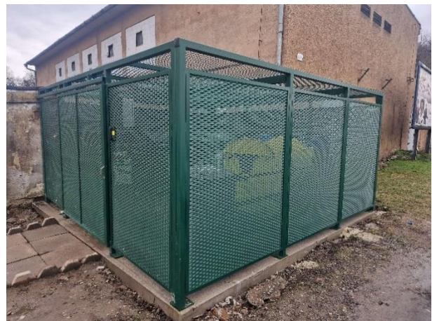
Obr. 6 Kontajnerovisko pri hoteli Strojár