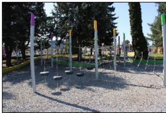
Obr. 71 Opičia lanová dráha