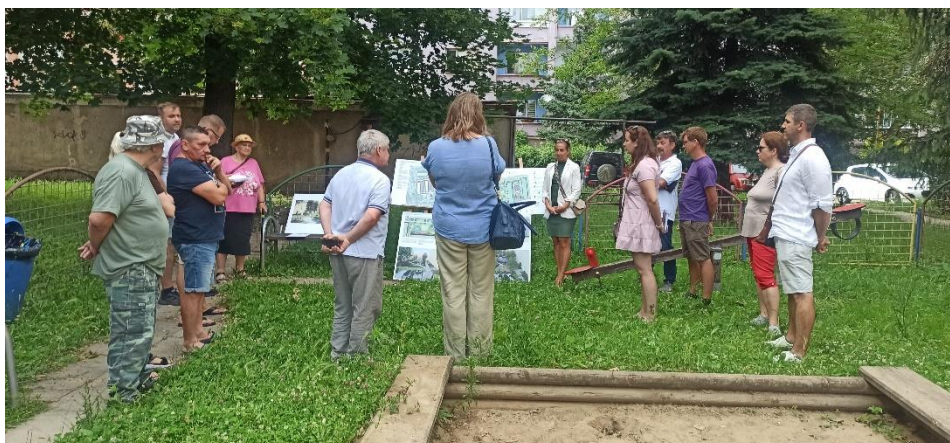
Obr. 13 Verejné prerokovanie štúdie Revitalizácia vnútro bloku Panelová - Srbská