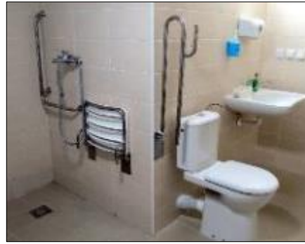
Obr. 28 a 29 Nové priestory ZOS na Mlynárskej 1 po rekonštrukcii

Po celý rok sa darilo ZOS držať v stave plnej obsadenosti. V zariadení sa zamestnanci starajú prevažne o úplne ležiacich pacientov, ktorým sa poskytuje 24 hodinová opatrovateľská a ošetrovateľská starostlivosť.