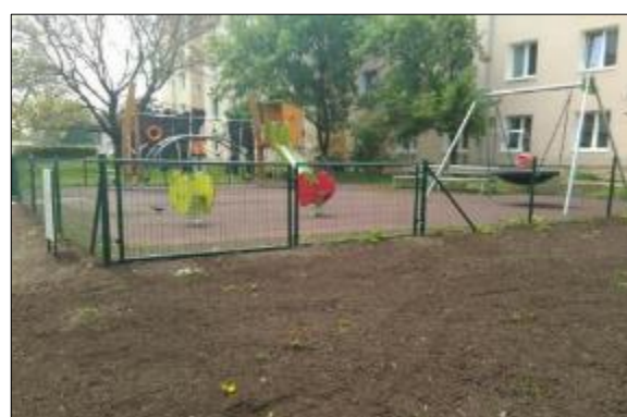
Obr. 51 Detské ihrisko Hombáľkovo

Všetky detské a športové ihriská s popisom a fotogalériou sú uvedené na webovej stránke www.kosicejuh.sk v časti Občan – Šport a voľný čas. #MAGENTALIFE Športovo - zábavný areál má svoju vlastnú webovú stránku www.alejko.sk .