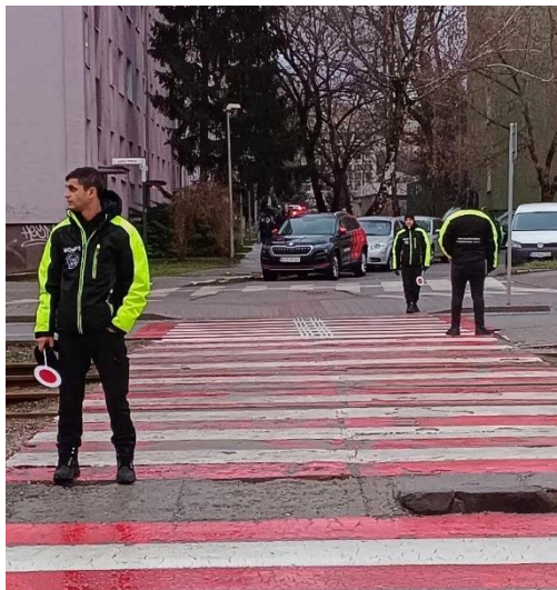
Obr. 41 Aktivity MOaPS

Miestne občianske a preventívne služby: V snahe zlepšenia stavu, poriadku v osadách s marginalizovanou rómskou komunitou v MČ Košice-Juh, sa MČ zapojila do projektu miestne občianske a preventívne služby (MOaPS) vyhlásenej Úradom splnomocnenca vlády pre rómske komunity, ako aj do vyhlásenej dotačnej schémy úradu splnomocnenca. Projekt podaný v rámci dotačnej schémy úspešný bol, od 1.4.2024 pôsobia v MČ Košice- Juh obsadenie 4 pracovníci MOaPS. Hliadky MOaPS prispievajú v prvom rade k zlepšeniu poriadku a bezpečnosti v lokalitách s marginalizovanou rómskou komunitou, podnecujú aj k ochrane životného