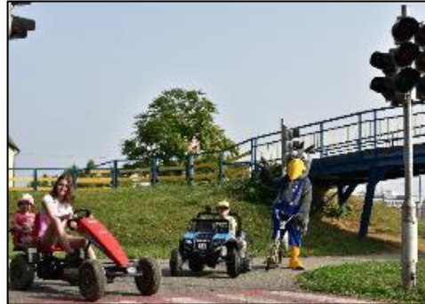
Obr. 60 a 61 Dopravné ihrisko

Ľadová plocha: v decembri 2006 bola sprístupnená verejnosti umelá ľadová plocha o rozmeroch 20x40 m s umelým chladením a osvetlením. Je vybavená profesionálnymi mantinelmi, hokejovými brámkami, ochrannými sieťami a striedačkami, plochu je možné využívať od novembra do marca za predpokladu denných teplôt do +12 st. Celzia, využíva sa na verejné korčuľovanie, amatérsky hokej, tréningovú činnosť hokejových tried ako aj na športovo-zábavné akcie pre obyvateľov mesta Košice. V roku 2014 sme pre najmenších korčuliarov zabezpečili pomôcku na ľad – 2 tučniakov a 2 pandy, ktoré sú nápomocné deťom pri prvých krokoch na ľade. V lete je možné priestor ľadovej plochy využiť aj pre iné športové aktivity ako tenis, speedminton, streetbal, florbal alebo amatérsky hokejbal. V roku 2016 sa ľadová plocha stala po prvýkrát dejiskom Nonstop 24 hodinového korčuľovania, ktoré je spojené so zápisom do knihy Slovenských rekordov. Získali sme 2 slovenské rekordy v počte korčuliarov na ľade počas 24 hodín (1610 korčuliarov) a v počte nakorčuľovaných kilometrov počas 24 hodín (1298 km). V decembri 2016 sme vlastný rekord v počte korčuliarov na ľade prekonal (6043 km). Tento rekord je zapísaný aj v americkej knihe rekordov Record Setter. V roku 2019 sme rekord v počte nakorčuľovaných kilometrov prekonal a jeho výsledná hodnota je 8 986 km. Na úpravu ľadovej plochy sme vďaka finančným prostriedkom z mesta Košice mohli zakúpiť rolbu, vďaka ktorej je kvalita ľadu omnoho vyššia.