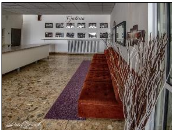
Obr. 37 a 38 Interiér Jedálne pre dôchodcov, Vojvodská 5 po úpravách v roku 2019 a 2020