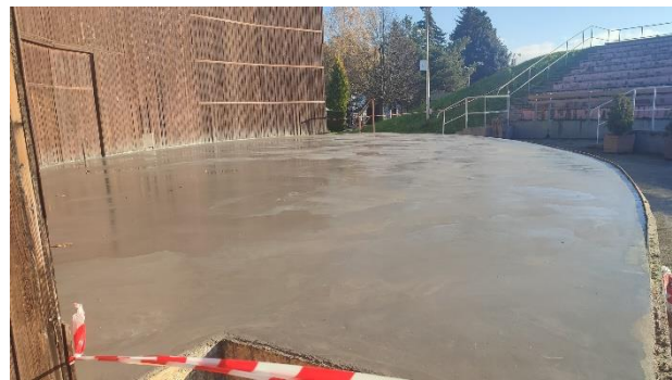
Obr. 64 a 65 Renovácia amfiteátra

Skate park: výstavba skate parku pre všetkých milovníkov tohto športu bola realizovaná v rokoch 2008 až 2009 a hneď od uvedenia do prevádzky si našiel svojich stálych športových nadšencov a návštevníkov.