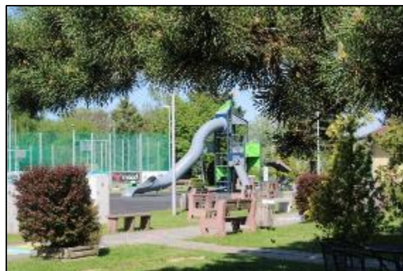
Obr. 59 Nová herná veža s tobogánom

Viacúčelové športové ihriská: v rokoch 2004 až 2006 boli vybudované tri viacúčelové ihriská s umelým trávnatým povrchom a umelým osvetlením s využitím na basketbal, volejbal, nohejbal, futbal či tenis. Ihriská je možné využívať celoročne, sú oplotené a vybavené brámkami, basketbalovými košmi a k dispozícii je aj požičovňa športových náradí a šatne.