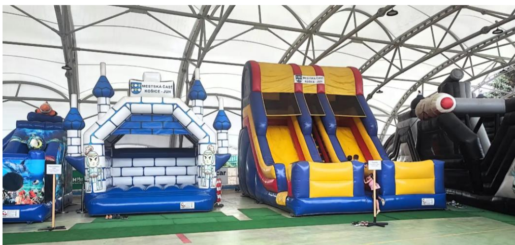
Obr. 72 Nafukovacie atrakcie pre deti v zábavnom centre