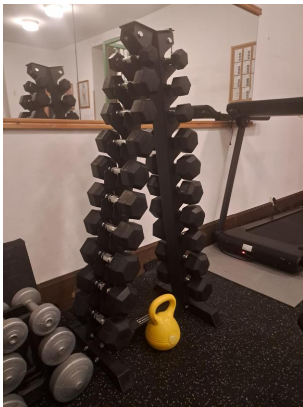
Obr. 14 Jednoručky v posilňovni Spoločensko-relaxačného centra