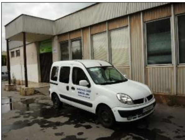
Obr. 33 Jedáleň pre dôchodcov, Vojvodská 5 pôvodný stav