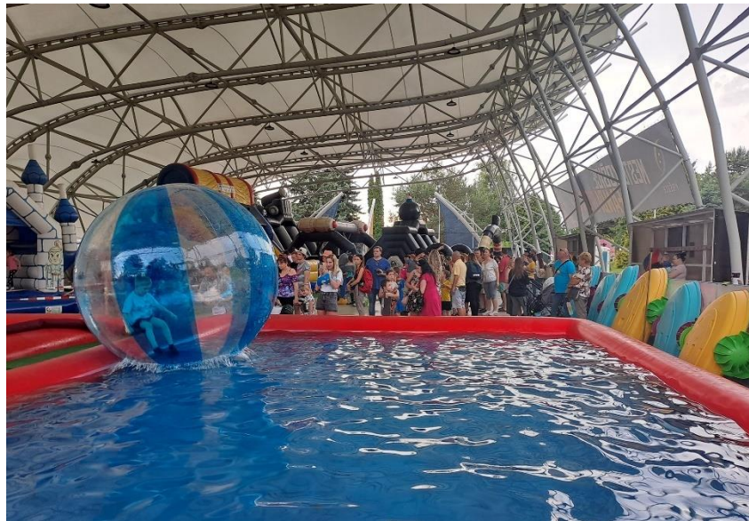
Obr. 76 Aquazorb