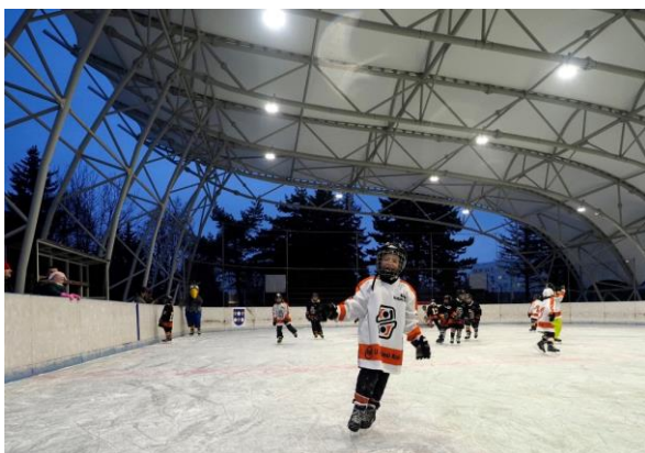
Obr. 62 Korčuľovanie s Alejkom

Ľadová plocha: v decembri 2006 bola sprístupnená verejnosti umelá ľadová plocha o rozmeroch 20x40 m s umelým chladením a osvetlením. Je vybavená profesionálnymi mantinelmi, hokejovými brámkami, ochrannými sieťami a striedačkami, plochu je možné využívať od novembra do marca za predpokladu denných teplôt do +12 st. Celzia, využíva sa na verejné korčuľovanie, amatérsky hokej, tréningovú činnosť hokejových tried ako aj na športovo-zábavné akcie pre obyvateľov mesta Košice. V roku 2014 sme pre najmenších korčuliarov zabezpečili pomôcku na ľad – 2 tučniakov a 2 pandy, ktoré sú nápomocné deťom pri prvých krokoch na ľade. V lete je možné priestor ľadovej plochy využiť aj pre iné športové aktivity ako tenis, speedminton, streetbal, florbal alebo amatérsky hokejbal. V roku 2016 sa ľadová plocha stala po prvýkrát dejiskom Nonstop 24 hodinového korčuľovania, ktoré je spojené so zápisom do knihy Slovenských rekordov. Získali sme 2 slovenské rekordy v počte korčuliarov na ľade počas 24 hodín (1610 korčuliarov) a v počte nakorčuľovaných kilometrov počas 24 hodín (1298 km). V decembri 2016 sme vlastný rekord v počte korčuliarov na ľade prekonal (6043 km). Tento rekord je zapísaný aj v americkej knihe rekordov Record Setter. V roku 2019 sme rekord v počte nakorčuľovaných kilometrov prekonal a jeho výsledná hodnota je 8 986 km. Na úpravu ľadovej plochy sme vďaka finančným prostriedkom z mesta Košice mohli zakúpiť rolbu, vďaka ktorej je kvalita ľadu omnoho vyššia.