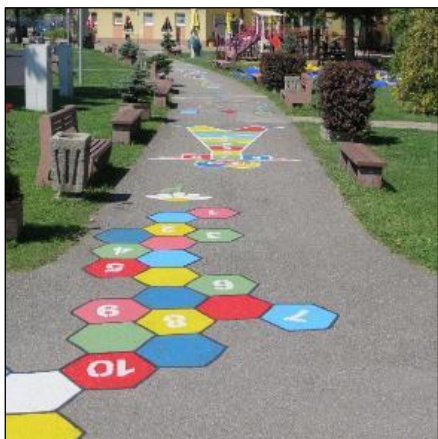
Obr. 72 Interaktívny skákací chodník