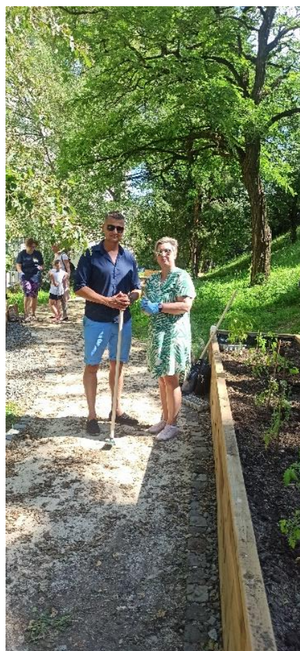
Obr. 10 a 11 Workshop Komunitná záhrada Turgenevova