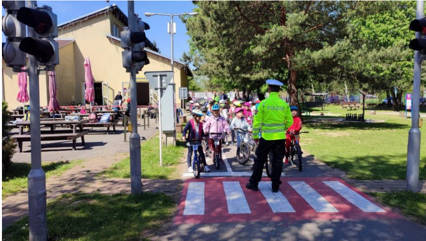
Obr. 75 Dopravná výchova