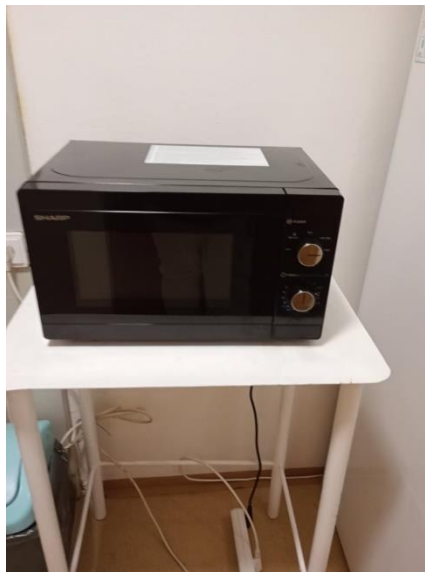
Obr. 30 a 31 Nové vozíky na rozvoz stravy, prádla pre klientov, nová mikrovlnná rúra

Terénna opatrovateľská služba – sa poskytuje na základe Štatútu mesta Košice z úrovne Mestskej časti Košice – Juh pre 6 mestských častí – Juh, Nad jazerom, Barca, Šebastovce, Vyšné Opátske a Krásna. V rámci opatrovateľskej služby sa predovšetkým poskytuje sociálna služba osobám, ktoré sú odkázané na pomoc inej fyzickej osoby a jej odkázanosť je v stupni najmenej II. a je odkázaná na pomoc pri úkonoch sebaobsluhy, úkonoch starostlivosti o svoju domácnosť a základných sociálnych aktivitách. Tieto služby sa v roku 2024 celkovo poskytovali pre cca 280 klientov, z toho má „komplexné služby“ 91 klientov a z nich 56 odoberá aj obedy a 181 klientom sa zabezpečuje iba dovoz obedov. MČ Košice Juh zabezpečuje dovoz obedov 3 autami, ktoré sú vybavené izotermickou nadstavbou.