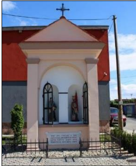
Obr. 25 Božia muka svätého Floriána a svätého Jána Nepomuckého

Božia muka svätého Floriána a svätého Jána Nepomuckého - pre tento typ sakrálnej stavby sa používa termín „božia muka“, od kaplnky sa líši tým, že nemá vnútorný priestor, do ktorého vojde človek. Bola postavená v roku 1826 ako odkaz na kresťanskú tradíciu odpúšťania dlhov a trestov za spáchané hriechy. Je vymurovaná z tehál a kameňa v klasicistickom štýle. V oblúkovite ukončenom výklenku sú vyhlbené dve hlbšie niky. V nich sa pôvodne nachádzali drevené sochy sv. Floriána a sv. Jána Nepomuckého. Svätci vytvárali klasickú zostavu ochrancov proti vode a ohňu.