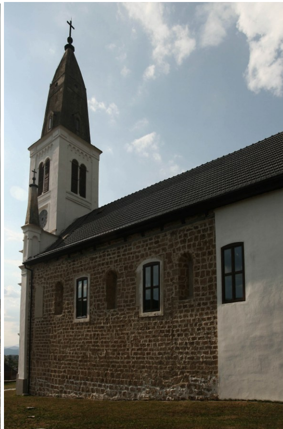
Kostol sv. Jána Krstiteľa