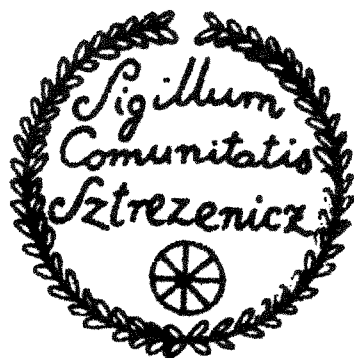
Historická obecná pečať Streženíc

Najstaršia zachovaná obecná pečať nemá datovanie. Použitá bola v roku 1860. Priemer pečate je 30 mm. V dolnej časti pečatného poľa je malé koleso voza, nad tým je kurzívou v troch riadkoch legenda: Sigillum Comunitatis Sztrezenicz . Vonkajší okraj pečate tvorí široká listovka. Odtlačok nedatovaného typára je uložený v Ústrednom archíve geodézie a kartografie v Bratislave.