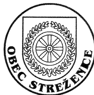
Obecná pečať s nápisom v dolnom segmente pečate