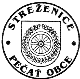
Obecná pečať s kruhopisom

Pečať obce je okrúhla, uprostred s obecným symbolom a kruhopisom OBEC STREŽENICE s priemerom 35 mm.