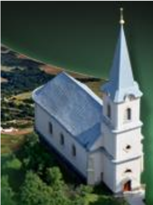
Sakrálnou dominantou Bohdanoviec je reformovaný kostol z roku 1637.