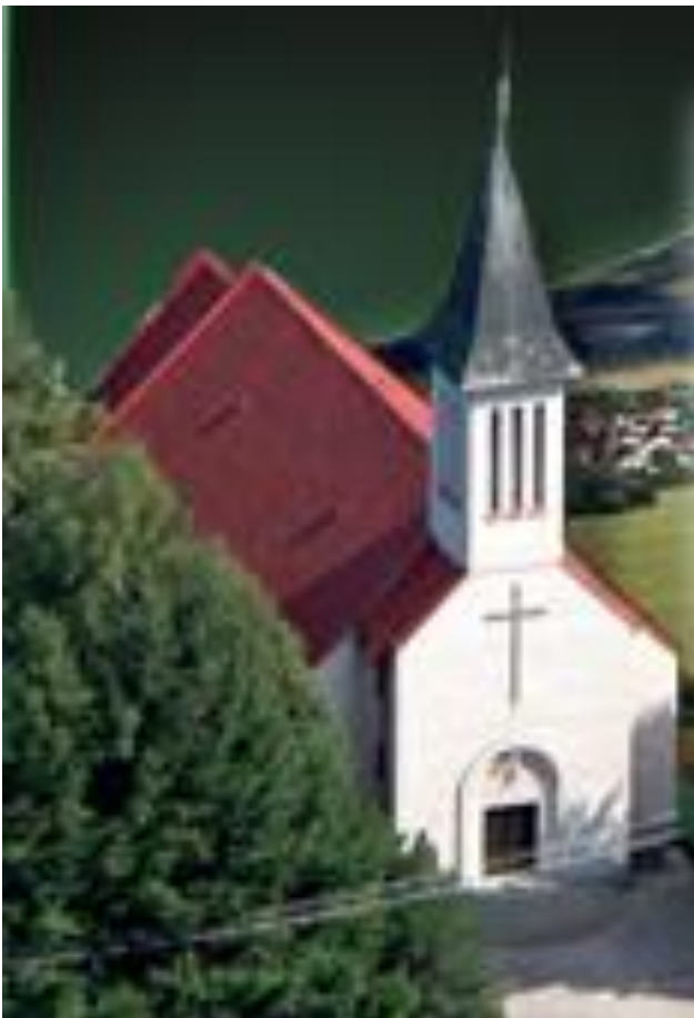
Novodobú sakrálnu architektúru reprezentuje rímskokatolícky Kostol sv. Margity Alacoque, ktorý bol postavený v roku 1943.