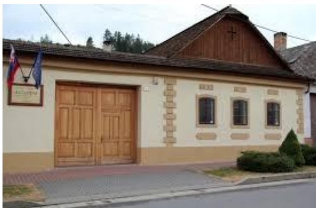
Meštiacky dom - národná kultúrna pamiatka

Alojz Schuster a Múzeum kinematografie rodiny Schusterovej -ucelená kolekcia kinematografickej techniky, etnografická zbierka a dokumenty hámorníckej výroby