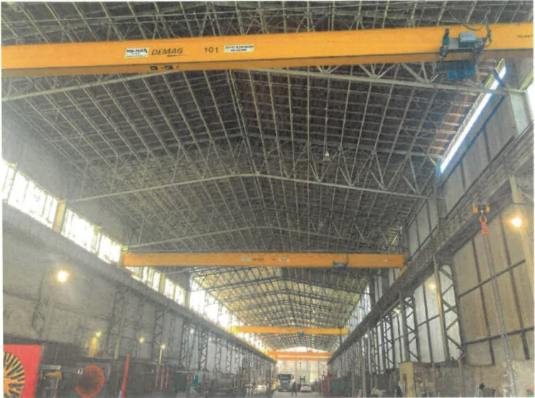
Obrázok: Stroje a zariadenia