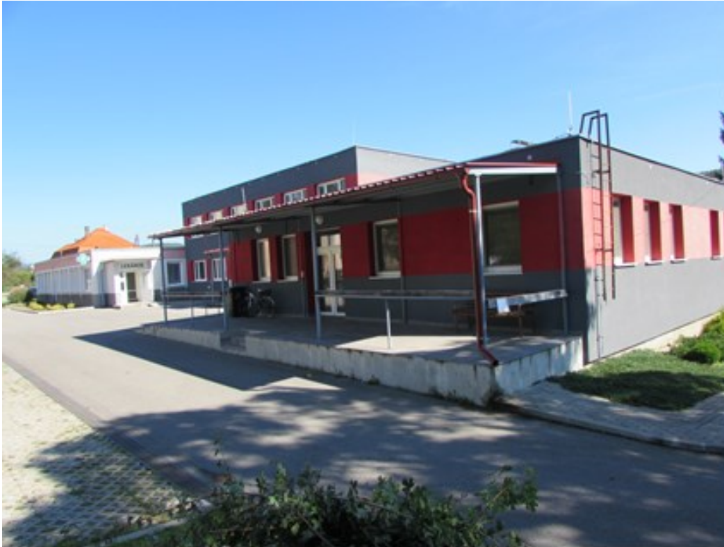
Budova zdravotného strediska, v pozadí lekáreň

Zdravotnú starostlivosť v obci a súčasne pre občanov mikroregiónu Uhrovská dolina poskytovala v zrekonštruovanom zdravotnom stredisku jedna lekárkou pre dospelých, ktorá však ku koncu roka presťahovala svoju ambulanciu do Bánoviec nad Bebravou, kde poskytuje zdravotnú starostlivosť aj tým občanom našej obce, ktorí chceli zostať v jej starostlivosti. Detská lekárka s praxou skončila už k 31.5.2019 a detskí pacienti prešli pod iných pediatrov v NsP v Bánovciach nad Bebravou. Súčasťou areálu je lekáreň, ktorá je v prevádzke aj naďalej. Na základe analýzy doterajšieho vývoja možno očakávať, že rozvoj zdravotnej starostlivosti sa bude orientovať na zvýšenú starostlivosť o seniorov.