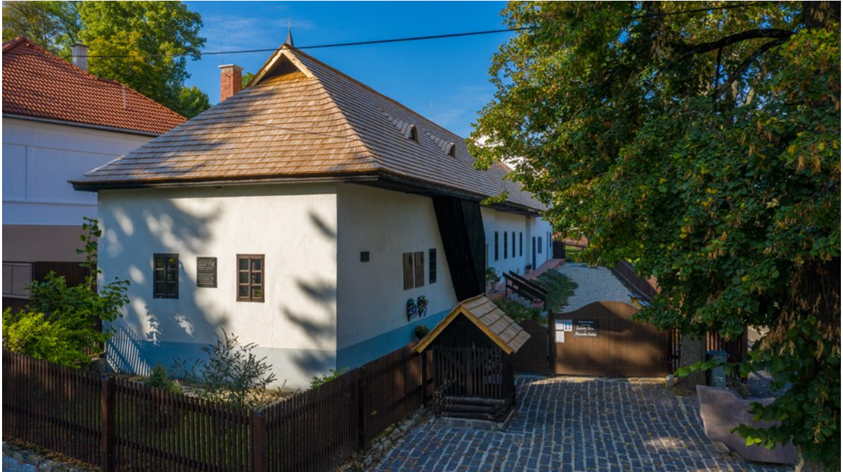
Národná kultúrna pamiatka.

Rodný dom Ľudovíta Štúra a Alexandra Dubčeka v Uhrovci je od roku 1970 národnou kultúrnou pamiatkou. Prvá expozícia venovaná životu a dielu Ľudovíta Štúra tu bola otvorená r. 1965 pri príležitosti osláv 150. výročia jeho narodenia. Expozícia zachytáva životné osudy, dielo a odkaz Ľ. Štúra, mysliteľa a politika, spoluzakladateľa spisovnej slovenčiny. Po rekonštrukcii objektu v roku 1979 bola verejnosti prístupná druhá rozšírená expozícia a v roku 1995 bola v zadnej časti domu otvorená expozícia, venovaná Alexandrovi Dubčekovi, ktorý sa v tom istom dome narodil o 106 rokov po Ľ. Štúrovi. (1921-1992).