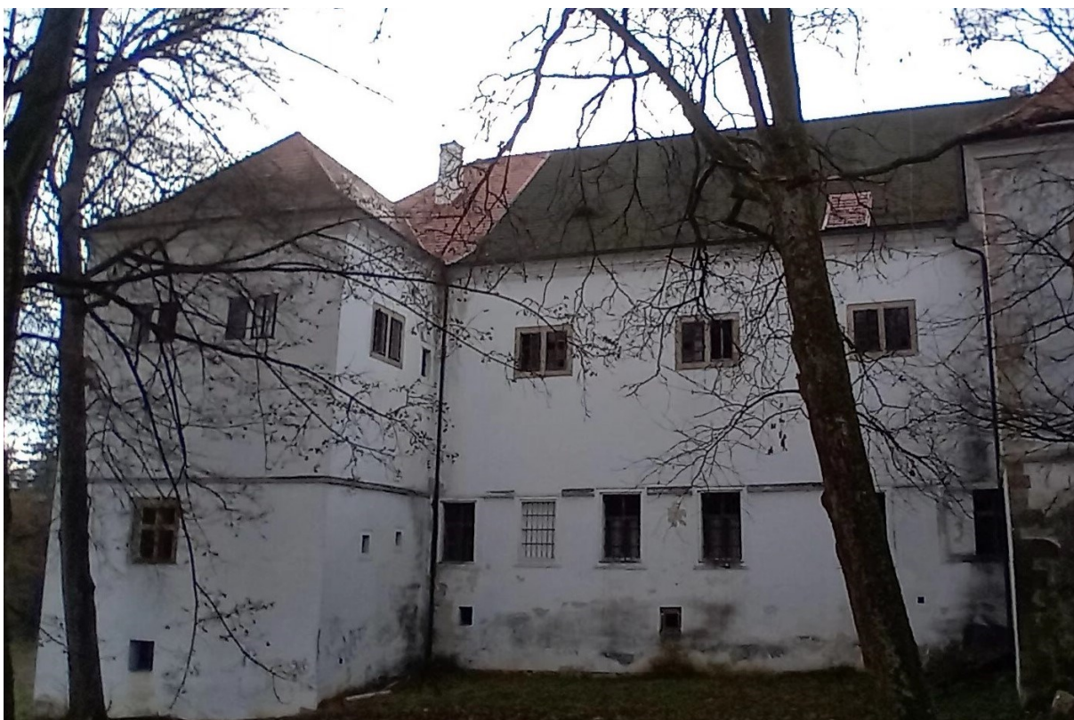
Časť strechy, ktorá je ešte v pôvodnom stave.