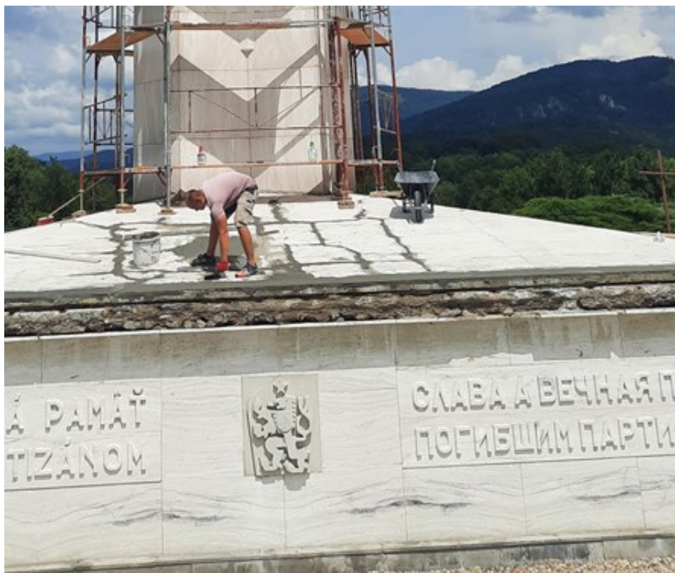
Práce na rekonštrukcii mohyly v roku 2024

a inštalovaný kamerový systém. Celková suma rekonštrukcie bola vo výške viac ako 206 tis. eur.