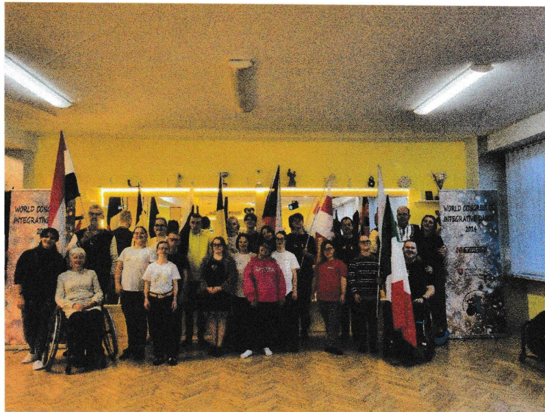
Tanečné podujatia a súťaže