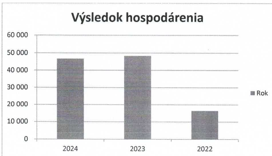
Vývoj tržieb za roky 2022 až 2024