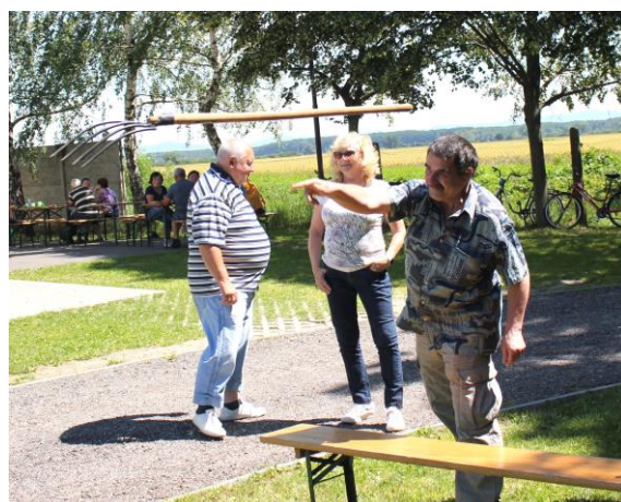
Športové hry Čáry