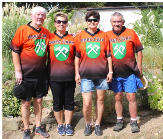
Okresné športové hry Senica