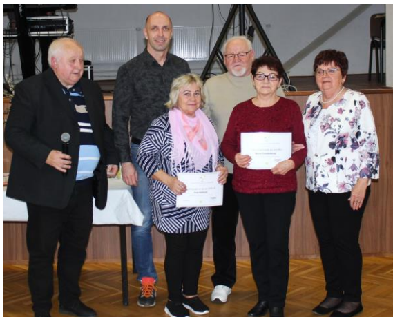
VČS – Vyznamenání 2024