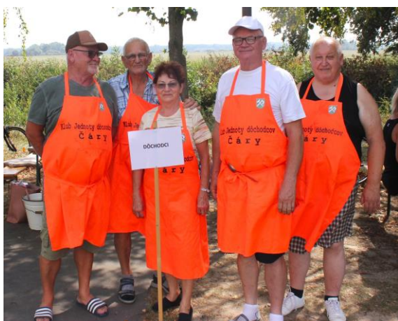
Guláš majster Čáry