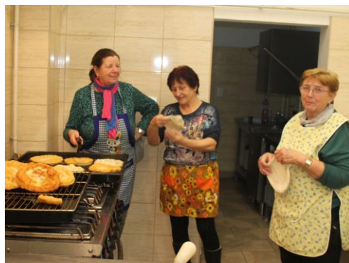
Vianočné trhy Čáry 2024