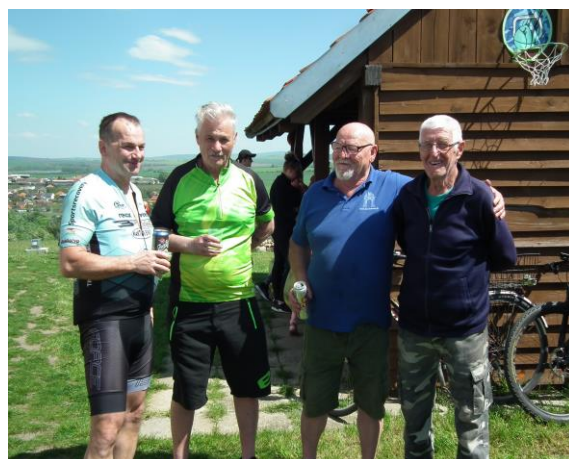
Cykloturistika Gbely Ostrý Vrch