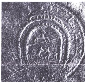
Pečat' z roku 1685