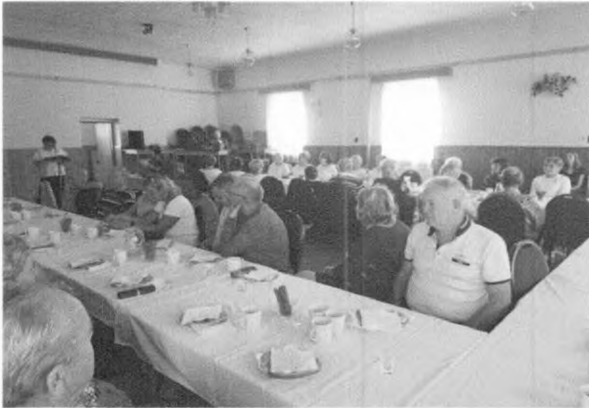
Posedenie s dôchodcami