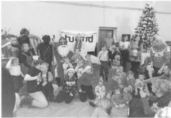
Posedenie s Mikulášom