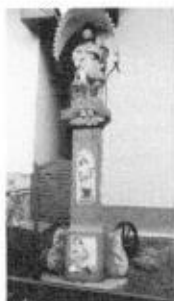
Socha sv. Rochusa