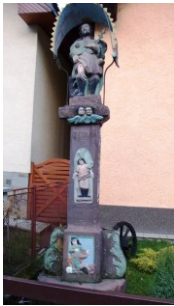
Socha sv. Rochusa