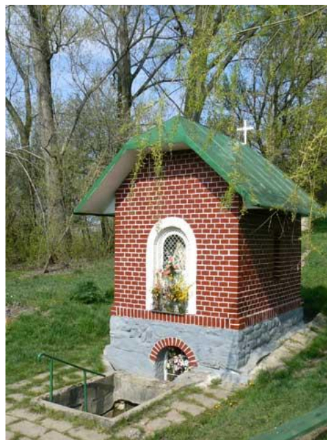
Pútnické miesto Cigléd