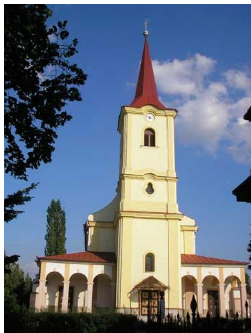
Rímsko - katolícky kostol