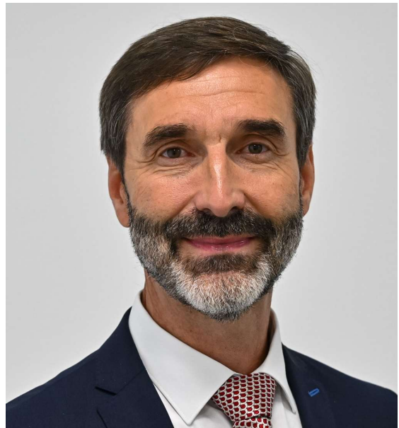
Juraj Blanár minister zahraničných vecí a európskych záležitostí Slovenskej republiky