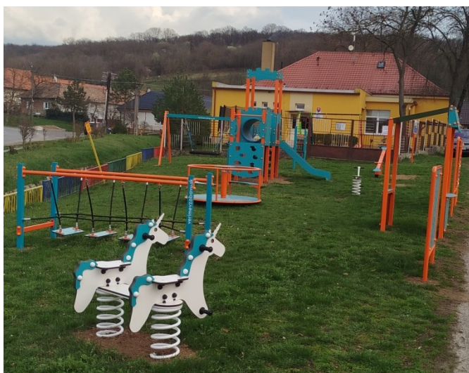
Obrázok 2: Detské ihrisko pri MŠ