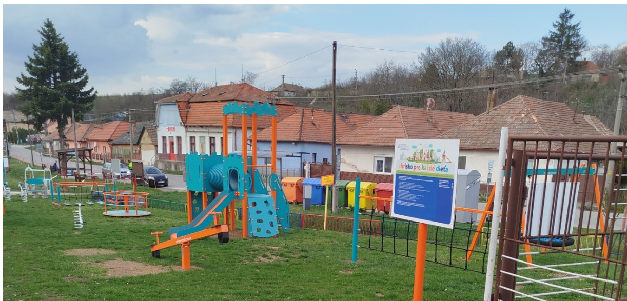
Obrázok 1: Detské ihrisko pri MŠ

V roku 2024 bolo novo postavené detské ihrisko pri budove materskej školy. Dotáciu na projekt poskytlo Ministerstvo práce, sociálnych vecí a rodiny SR vo výške =27500€. Obec sa na financovaní podieľala spoluúčasťou =3500,-€. Detské ihrisko bolo uvedené do používania v roku 2025.