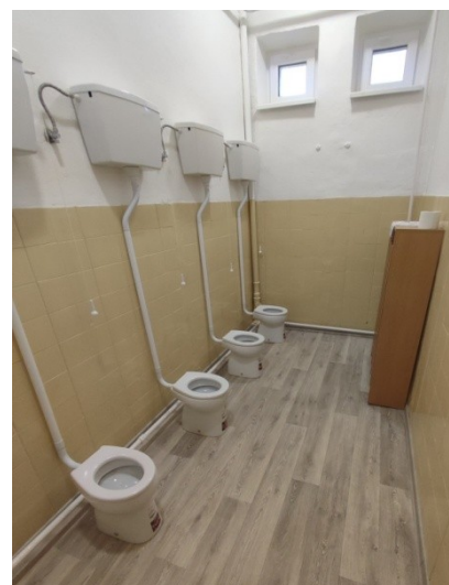
Obrázok 3: Zrekonštruované toalety v MŠ

V roku 2024 boli zrekonštruované sociálne zariadenia v budove materskej školy tak, aby vyhovovali potrebám škôlkarov a hygienickým štandardom. Rekonštrukcia bola financovaná z vlastných zdrojov obce. Zrekonštruovaná bola podlaha, osadené boli nové WC misy, miestnosť bola vymalovaná.