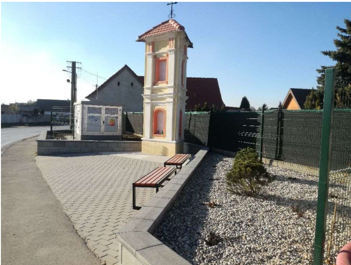
Postavená na prelome 18. a 19. storočia v klasicistickom slohu na pamiatku prekrstenia pôvodného