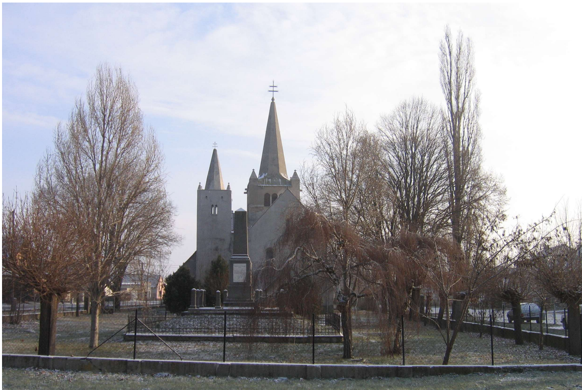
Božia muka pri dome č. 80–č.ÚZKP 10704/0 – vlastník Obecný úrad Most pri Bratislave