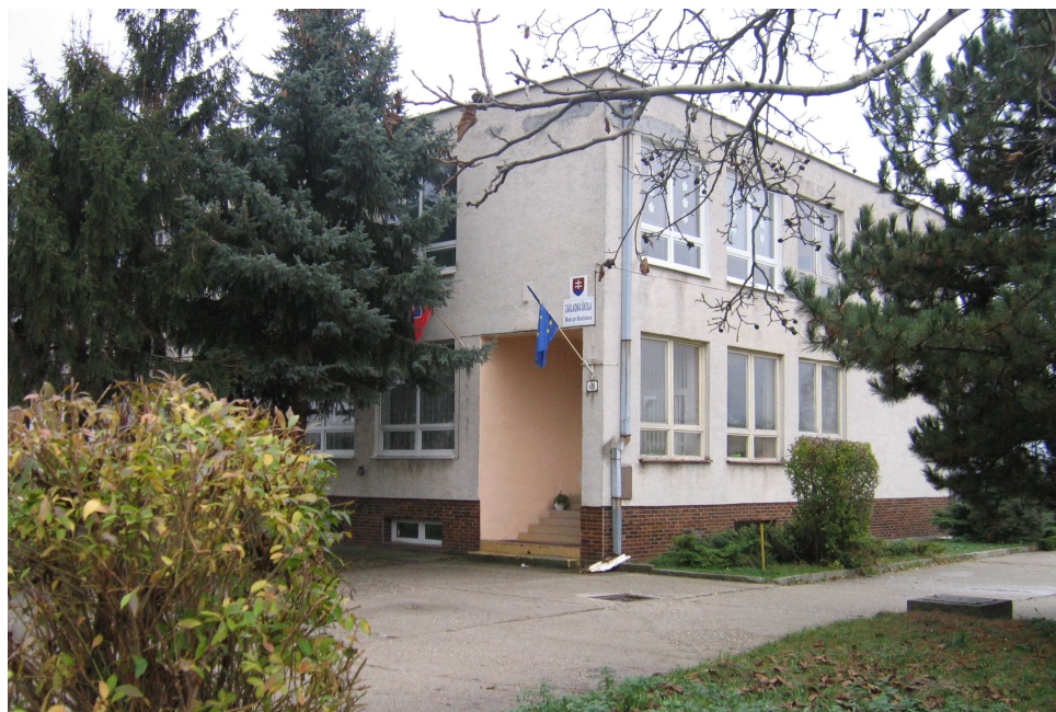
Základná škola, Športová 470, Most pri Bratislave, ktorá sídli v dvoch budovách

V súčasnosti výchovu a vzdelávanie detí v obci poskytuje: