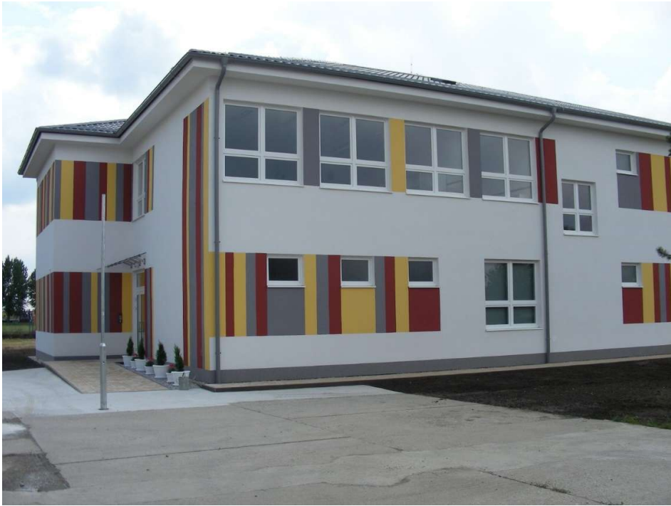
Materská škola, ul. 29. augusta 384, Most pri Bratislave