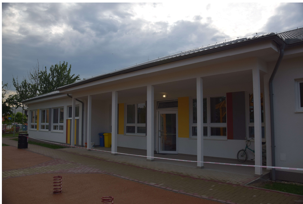
Materská škola, elokované pracovisko, Športová 1384, Most pri Bratislave

Obci Most pri Bratislave boli poskytnuté finančné prostriedky vo výške 200 000,- Eur z MV SR, určené na výstavbu novej telocvične pre základnú školu, ktorá od svojho vzniku nedisponovala telocvičňou. Stavba bola dokončená v decembri 2017, skvalitnil sa priestor pre rozvoj výchovy a vzdelávania žiakov v oblasti telesnej a športovej výchovy.