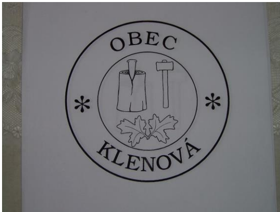
Pečať obce :

2/9 bielej 1/9, zelenej 2/9, žltej 1/9, zelenej 2/9 a žltej 1/9.