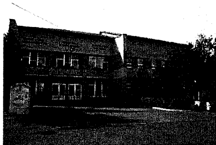
KOSTOL SV. ŠTEFANA KRÁEA A KULTÚRNY DOM V BISKUPICIACH